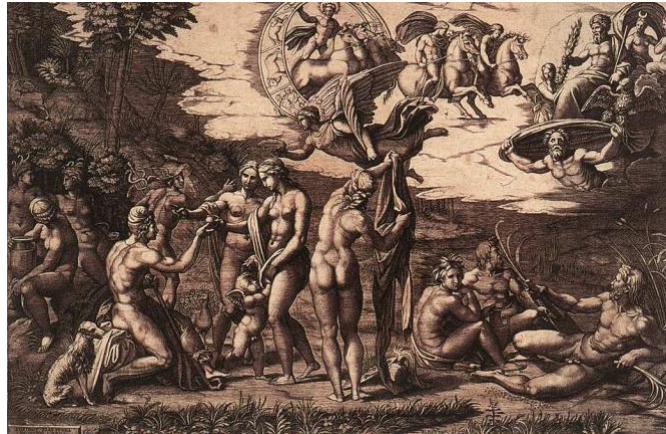
3. Juicio de Paris . Grabado de Marcantonio Raimondi reproduciendo el fresco perdido de Rafael. Ca.1515

de entonces. En el grabado encontramos a Paris con el gorro frigio a la izquierda, desnudo y acompañado de un perro y un bastón de pastor. Entrega la manzana a Afrodita, acompañada de Eros. Hera aparece con el pavo real y Atenea nos da la espalda, con su casco en el suelo. Hermes aparece con el caduceo rematado en serpientes y el pétaso. Zeus se encuentra en las escenas superiores, junto al águila y a Artemisa. La Victoria, alada, corona a Afrodita.