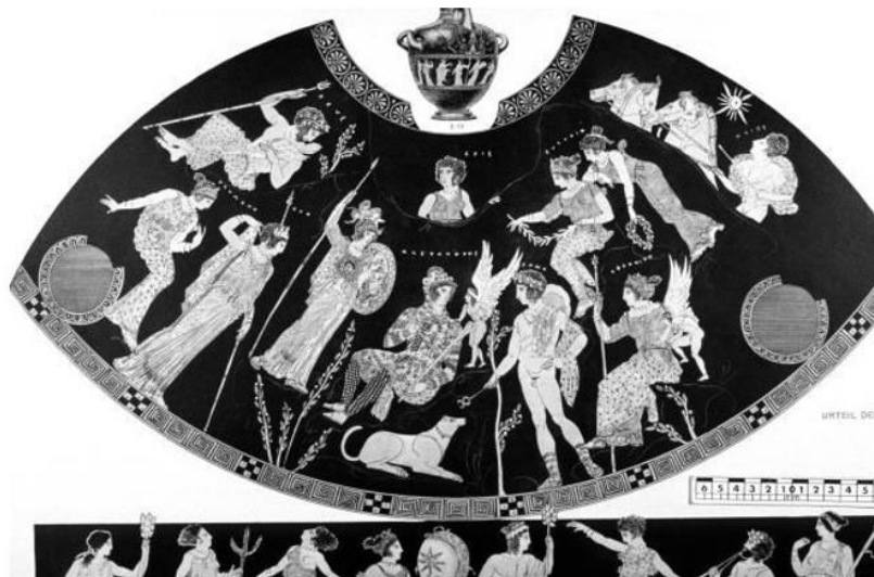
2. Hidria ática de figuras rojas . Pintor del Paris de Carlshue. c. 400 a.C