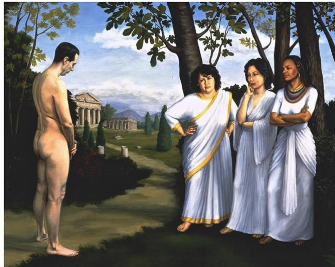
5. Juicio de Paris . Mary Ellen Croteau. 2006