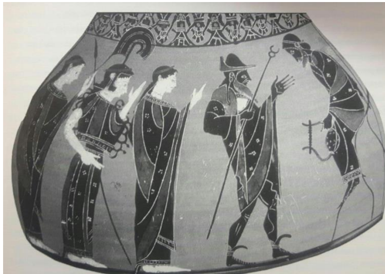
1. Juicio de Paris . Ánfora ática de figuras negras. 540 – 350 a.C. British Museum, Londres

del mito, dotando ya a las diosas con algunos de sus atributos. Ejemplos de todo ello los encontramos en el Juicio de Paris del ánfora ática de figuras negras del British Museum de Londres (540 – 350 a.C.) [1] en contraste con las hidrias áticas de figuras rojas del pintor del enócoe de Yale (ca.470 a.C.) y del pintor de Paris de Carlshue (ca.400 a.C.) [2]. “Ninguna diosa, en el arte griego, se destapaba, y sólo en Época Romana surge, de forma incipiente, la desnudez de Afrodita, ya por entonces [era] normal en sus imágenes representativa” (Elvira, 2008: 449). Sin embargo, Paris sí podía aparecer desnudo. Vemos como el mito es de gran interés para los ceramistas áticos, extendido después a los talleres itálicos.