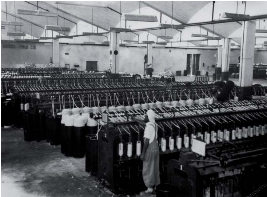
Imagen 2: Vista parcial de la planta