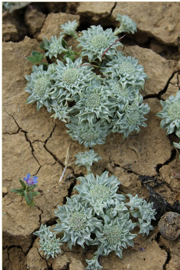
Fig. 1: Filago hispanica , en las proximidades de la Fuente de la Muchacha (Cuenca).

mente convexo y compuesto por numerosos capítulos sésiles y cilíndricos. Receptáculo plano; con hasta 15 páleas por capítulo, que son oblongas, naviculares, algo-donosas en el ápice y escariosas en la fructificación, que engloban casi por completo la flor de su axila. Flores externas femeninas, internas hermafroditas y sin vilano. Aquenios elipsoidales a cilíndricos, cortamente pelosos.