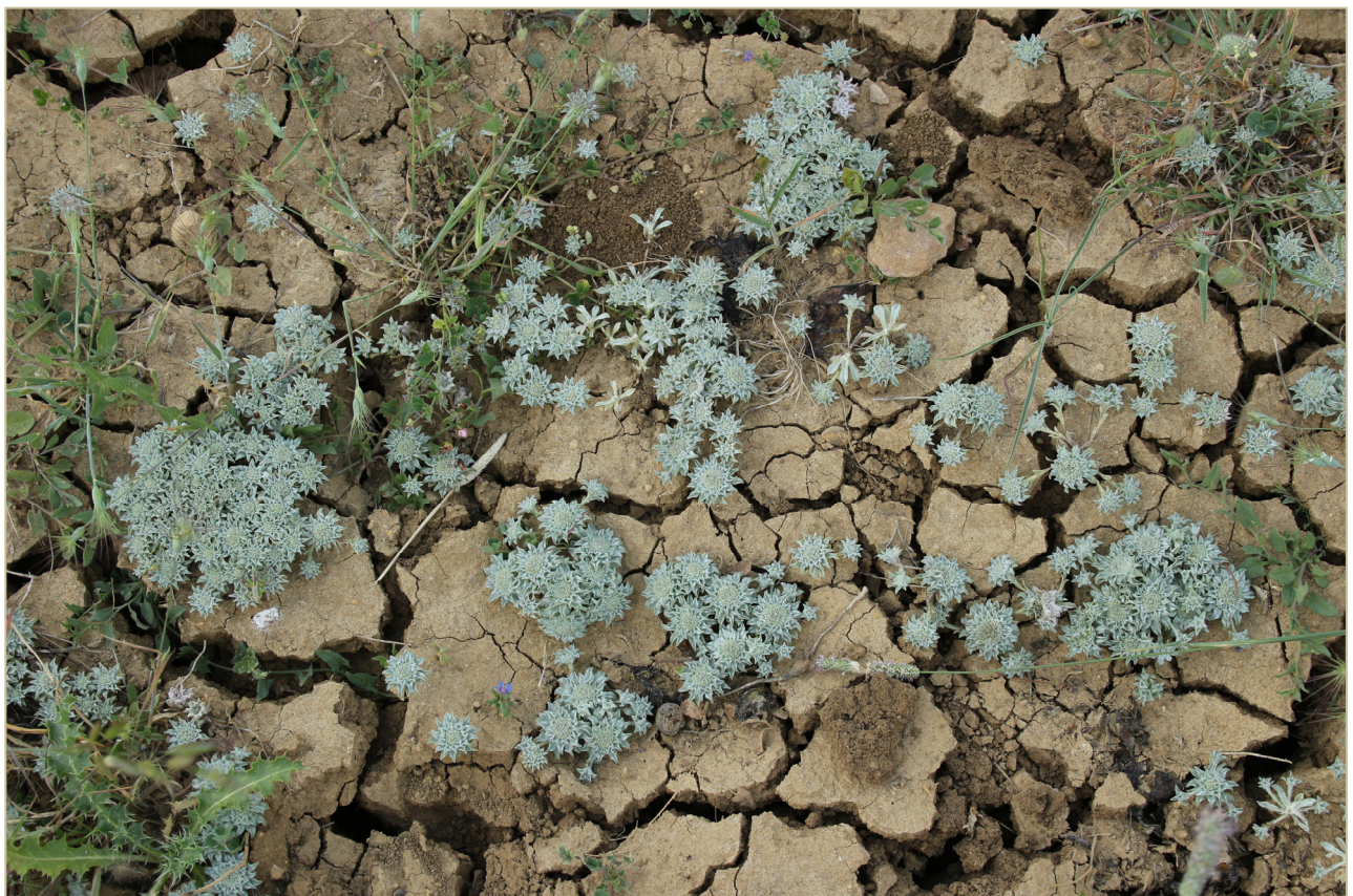
Fig. 4: Comunidad de Filago hispanica en pastizales de la As. Trifolium fragiferi - Cynodontetum dactyli Br.-Bl. & O. Bolòs 1958 en las proximidades de la Fuente de la Muchacha (Cuenca).