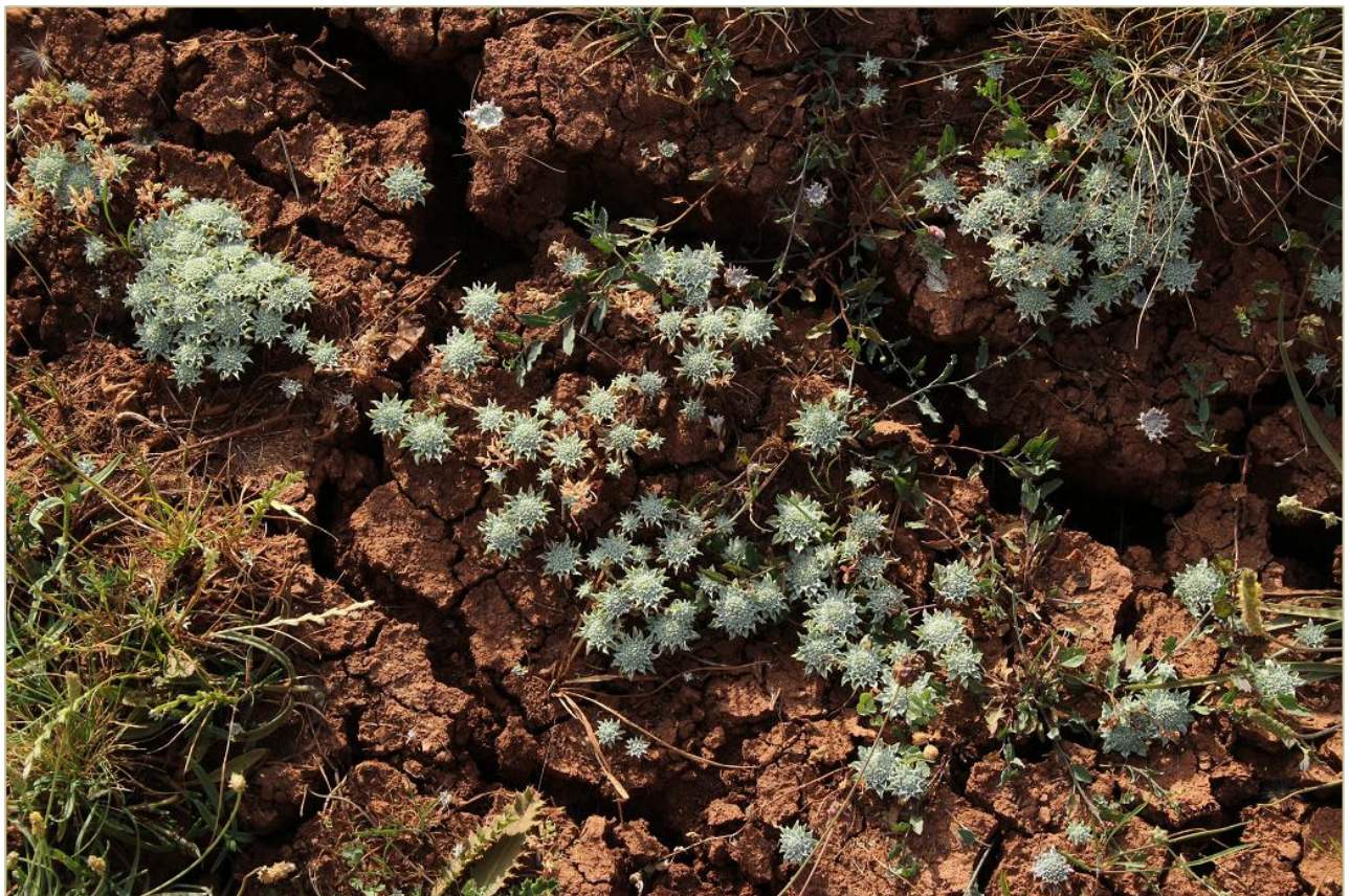
Fig. 6: Comunidad de Filago hispanica en claros de pastizales de la As. Cirsio microcephalae-Onobrychidetum hispanicae Rivas Goday & Borja 1961 corr. Rivas-Martínez, Fernández-González & Loidi 1999 en el Maillo (Cuenca).