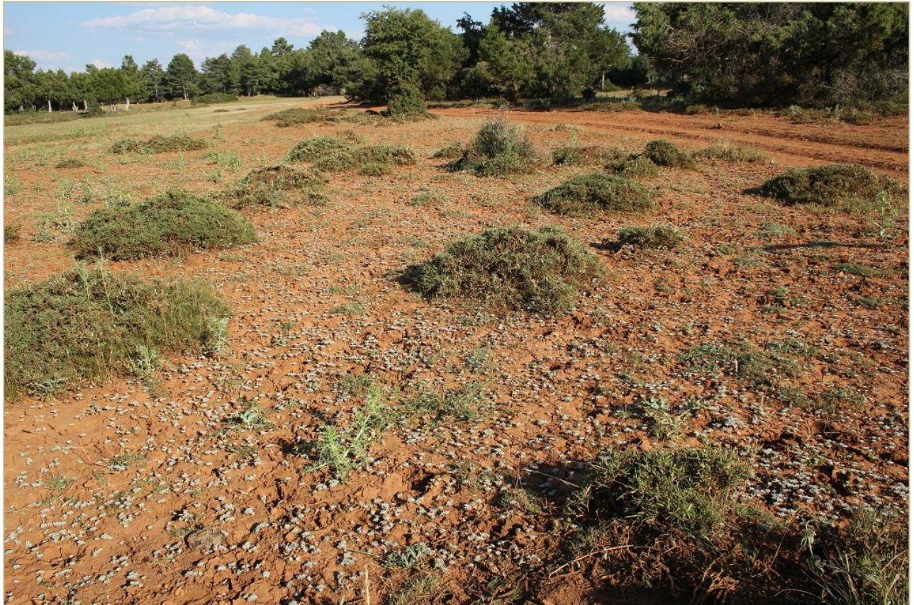
Fig. 5: Extensa comunidad de Filago hispanica en cambronales intercalados con pastizales de la Al. Sideritido fontquerianae-Arenarion aggregatae Rivas Goday & Borja 1961 corr. Rivas-Martínez & al. 2002 en los Tragaderos (Cuenca).