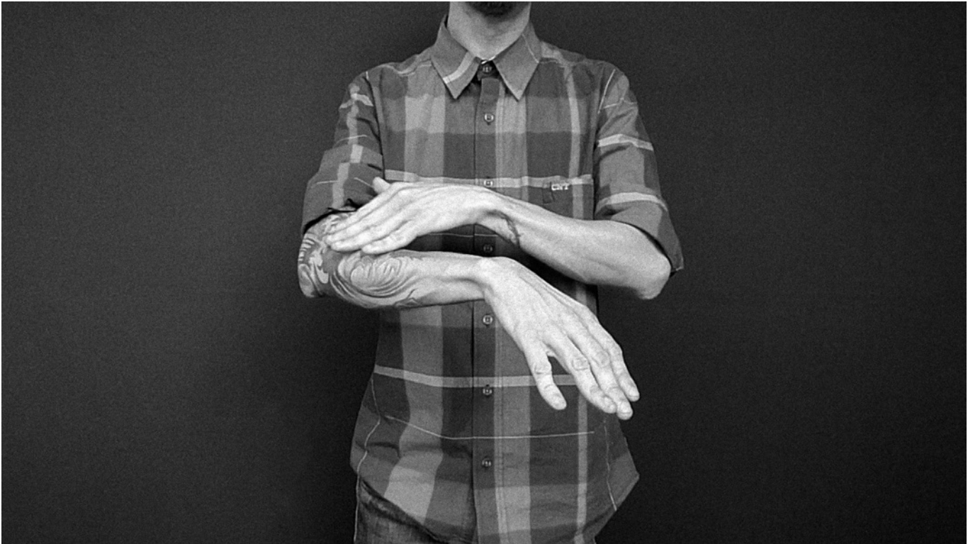
Imagen 1. Transducciones . (Álvarez, 2017). Imagen extraída del video para la video instalación. Dimensiones variables.