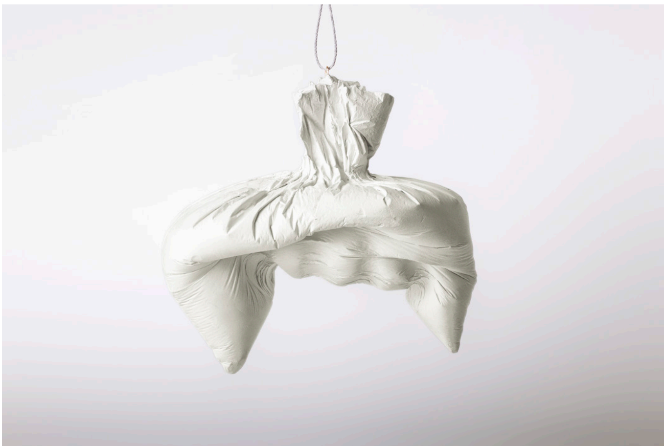
Imagen 5. Bolsa de ideas sublimadas . (Álvarez, 2017). Vaciado en yeso. 22x12x20cm.

preguntas iniciales, hasta materializar estéticamente las construcciones epistémicas que se produjeron en el contexto de la práctica investigativa. En este modo de proceder el investigador dejó esos lugares de seguridad, otrora valorados, para abrirse a una experimentación que atravesó la propia subjetividad, de manera que se compusieron otras líneas en la experiencia interpretativa y en el rigor ético-estético. En este sentido la creación artística, en lugar de verse arrinconada por la investigación educativa, se valió de algunos de sus aspectos para encontrar otras vertientes de formalización inicialmente no contempladas.