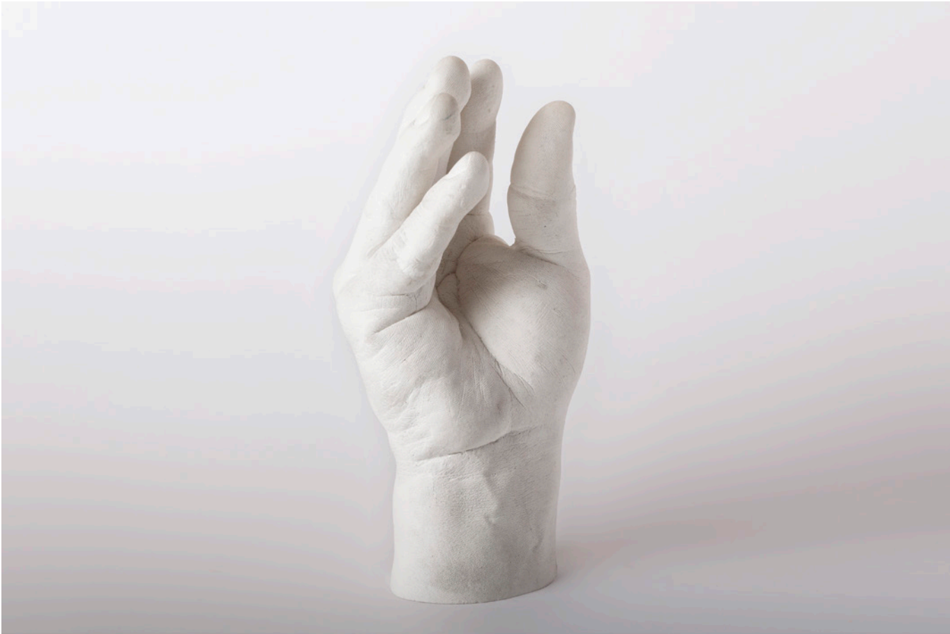
Imagen 4. Gesto #1: Comelón . (Álvarez, 2017). Vaciado en yeso. 18x9x7,5cm.

La exploración formal inicial se realizó con vaciados de yeso y concreto.