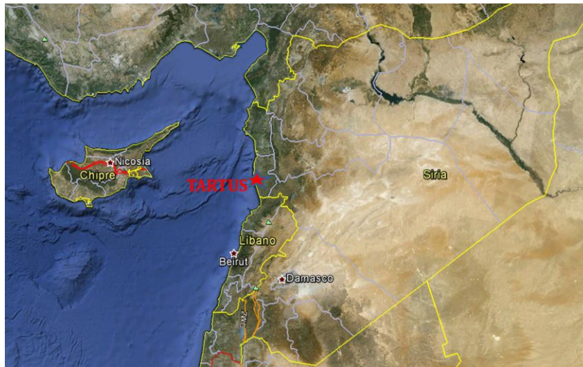
Ubicación de la Base de Tartus 10

Según fuentes oficiales de la armada rusa Tartus aumenta significativamente las capacidades operacionales de la armada rusa en la región. Desde dicha ubicación se pueden desplazar en un periodo relativamente corto de tiempo, cuestión de días, al Mar Rojo a través del Canal de Suez, o al Océano Atlántico a través del estrecho de Gibraltar.