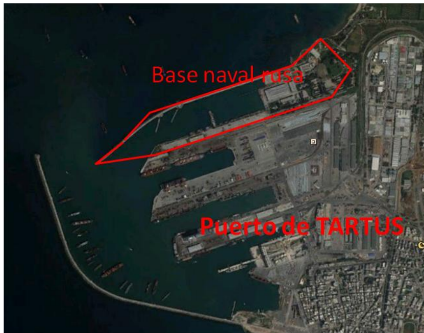
Delimitación de la Base Naval Rusa en el puerto de Tartus 9

Las instalaciones solo han sido modificadas en el año 2009 para poder albergar a los grandes buques de propulsión nuclear. Realmente la parte rusa de la Base se limita a unos pequeños barracones con capacidad para unas 50 personas y otras 190 en alojamientos flotantes, el muelle, los tanques de combustible y otros pequeños edificios de apoyo.