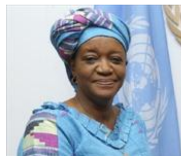
Zainab Hawa Bangura.

Podemos y debemos ser optimistas. Zainab Hawa Bangura 17 , Enviada Especial del Secretario General de la ONU sobre la Violencia Sexual en los Conflictos, afirmaba en la presentación de la Declaración 18 , que ésta representa un faro de luz y esperanza. “Tenemos la oportunidad, como nunca antes en la historia, de desvertebrar este antiguo mal” 19 .