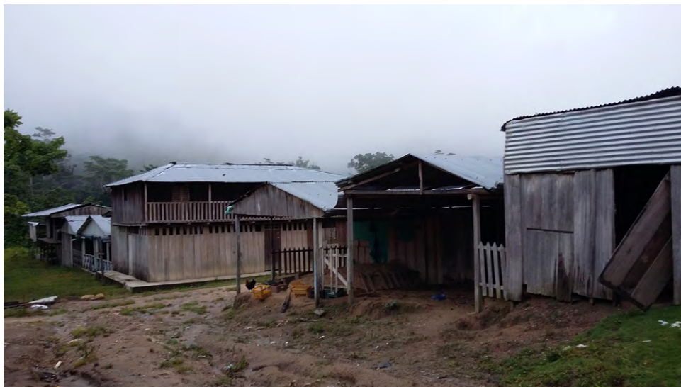
Figura 4. San Juan del río Grande, caserío deshabitado después de las incursiones paramilitares

Nota. Archivo personal. Figueroa, H., 2016