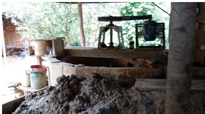
Nota. Archivo personal. Figueroa, H., 2016