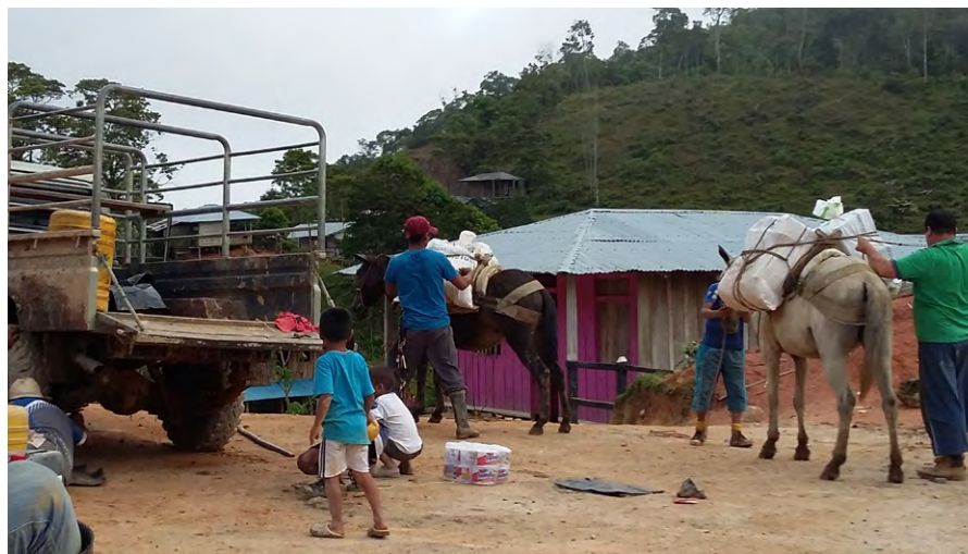
Figura 5. Vereda Palma Chica