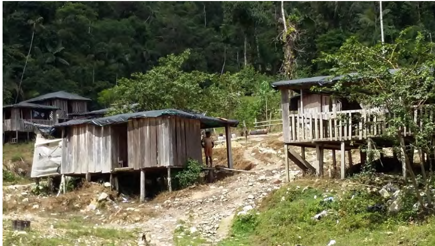
Figura 6. Caserío Santa Fé de La Vega, fundado por barequeros chocoanos