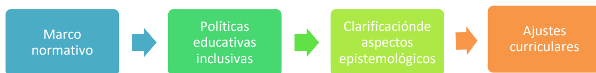
Ilustración 1. Retos de la educación inclusiva.

Partiendo de las ideas presentadas anteriormente señalan la preeminencia de la de adecuar los aspectos medulares identificados a nivel de Latinoamérica y el Caribe, tales como el marco normativo adecuado, políticas y programas educativos, la clarificación epistemológica en relación a la educación inclusiva, la identificación de los grupos considerados como vulnerables y el diseño de un currículum que responda la igualdad de oportunidades y la inclusión entre otros aspectos.