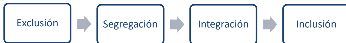
Ilustración 2. Ruta de la inclusión (Elaboración propia)