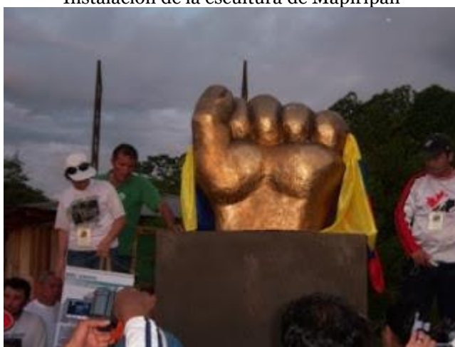
Ilustración 3 Instalación de la escultura de Mapiripán