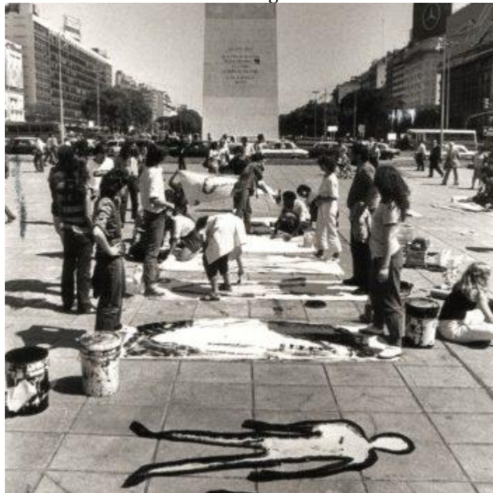
Ilustración 1 Siluetazo argentino