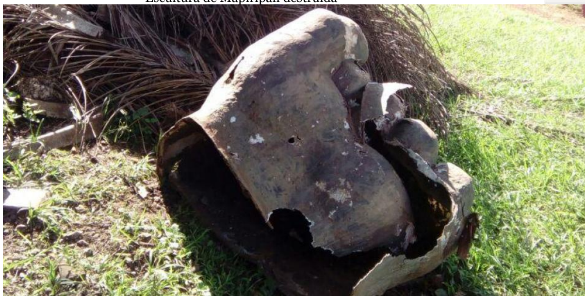
Ilustración 4 Escultura de Mapiripán destruida