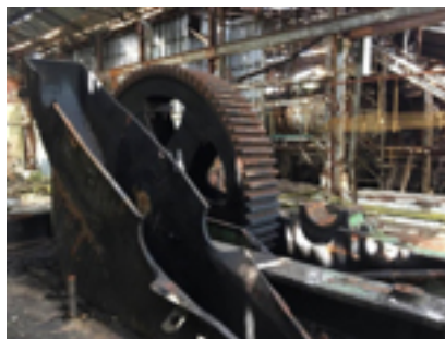
Central Aguirre, 2017

En cuanto a Aguirre, el poblado de compañía fue un experimento social controlado, o modelado conforme a un patrón segregacionista, como si el diseño fuera un spillover del ordenamiento del laboratorio. Hay alguna relación entre el diseño del laboratorio y el diseño fordista de la fábrica, supongo.