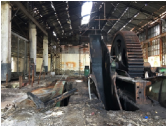
Cuarto de máquinas, Central Aguirre, 2017

las transformaciones del paisaje y el entorno acarreadas por el surgimiento, colapso y relevos de la agroindustria azucarera en el litoral sur de la isla. En esta costa caribeña todavía se encuentran, próximos a las ruinas de la Central Aguirre, los últimos habitantes del company town del que fuera uno de los emporios azucareros principales de Puerto Rico y el Caribe, modernizado tras la ocupación y el cambio de soberanía en 1898. La imagen del litoral caribeño --enclave abierto al tránsito y ocupación de varios imperios, fugas cimarronas y contrabandos de todo tipo-- cobra un sentido particular en PR 3 Aguirre como instancia localizada de fuerzas globales, comprimidas en esa mínima encrucijada planetaria donde se superponen y se mezclan --como estratos geológicos del territorio-- los tiempos múltiples de una modernidad colonial en ruinas.