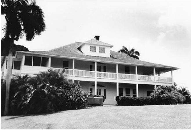
Casa de administradores altos en el “company town” de Aguirre a comienzos de siglo XX.