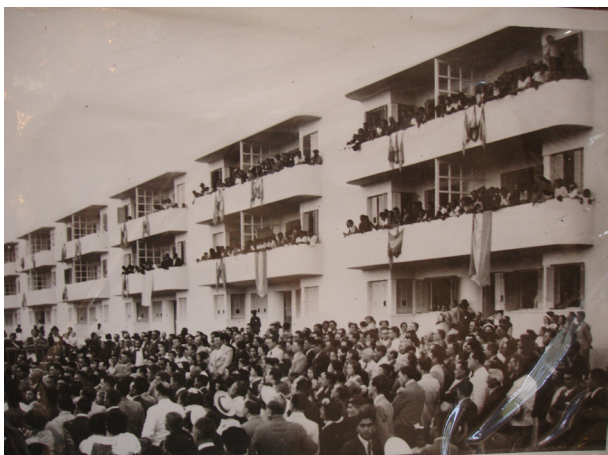
Fig. 1. Vista del Barrio Cano. Fotografía de 1938.

Como se observa las acciones relacionadas al tema de la vivienda se mantuvieron casi completamente restringidas al ámbito teórico.