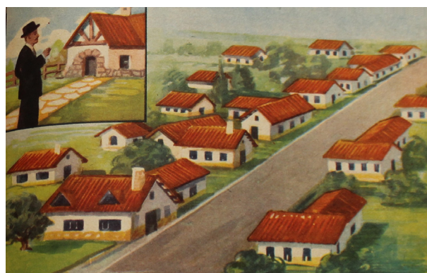
Fig. 2. Barrio de viviendas peronistas. La Nación. 1950. Pág. 149. Museo del Pasado Cuyano. Mendoza. Argentina.

En Mendoza, al inicio del primer peronismo, la situación habitacional era crítica. Según el Censo Escolar de la Nación, realizado en 1943, en la