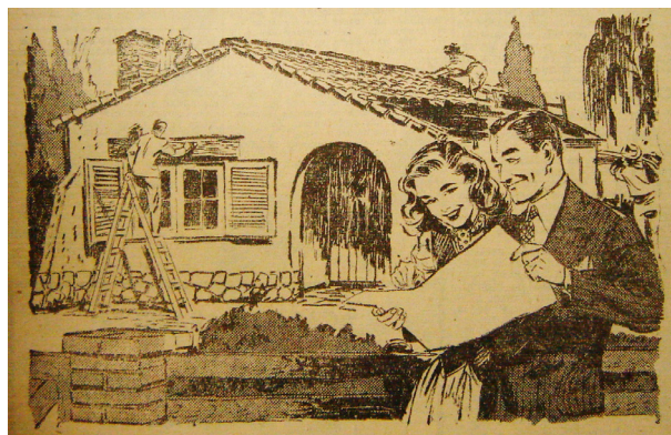
Fig. 3. Publicidad de vivienda. Diario Los Andes. 11 de julio de 1948. Pág. 5. Hemeroteca Mayor de la Biblioteca pública General San Martín. Mendoza. Argentina.

La tipología de vivienda que se concretó por medio de las gestiones de los Institutos fue la unifamiliar de planta tipo cajón, en lotes cuyas dimensiones permitían tener un jardín y, en algunos casos, una huerta. Predominó el chalet suburbano que se transformó en uno de los íconos peronistas por excelencia, símbolo del ascenso social de las clases trabajadoras. La difusión que implicó su implementación masiva fue reforzada por su empleo en la propaganda política y con una fuerte carga simbólica 16 . Si