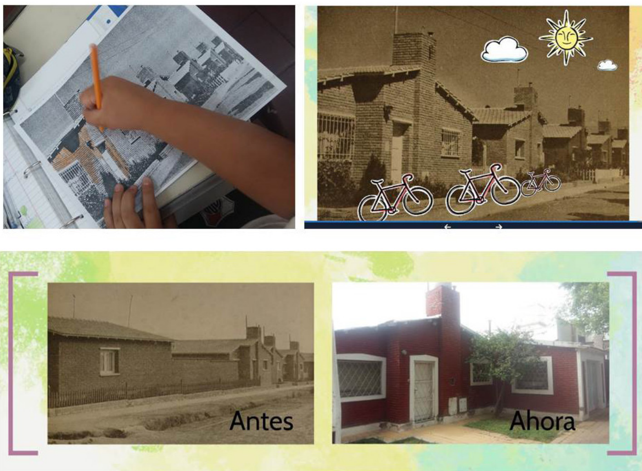
Fig. 6. Imágenes de la experiencia El Barrio de mi escuela. Verónica Cremaschi. 2018. Mendoza. Argentina.

“del espacio vivido”, registrados a partir de las entrevistas 34 .