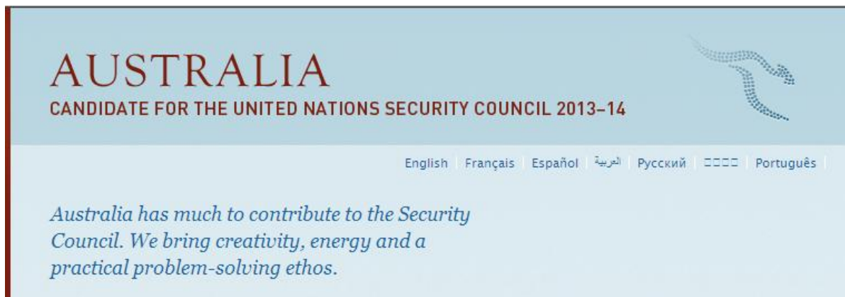
Figura 5: Imagen de la web 9 de la candidatura de Australia

Además, Australia es uno de los diez principales contribuyentes a la Organización Mundial de la Salud, al Programa Mundial de Alimentos, al Fondo de las Naciones Unidas para la Infancia, al Fondo Central para la Acción en casos de Emergencia de las Naciones Unidas, al Alto Comisionado de las Naciones Unidas para los Refugiados y al Fondo Fiduciario de las Naciones Unidas para los Pueblos Indígenas