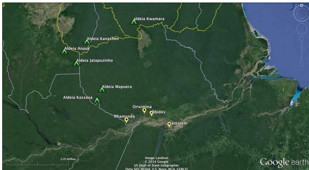
Mapa (3) municípios no baixo curso dos rios Nhamundá e Trombetas e principais aldeias na área estudada hoje.

Sobre os documentos e registros históricos acerca desses grupos indígenas, possuímos poucas informações (tal como há uma ausência de dados arqueológicos) e, menos ainda, sínteses e análises confiáveis sobre os poucos registros existentes. Há referências esparsas sobre os índios Conduri, que teriam sido reunidos, no início da ocupação europeia do continente, na localidade onde se situa a atual cidade de Nhamundá, no Amazonas. Tais índios também teriam sido avistados pelo missionário espanhol Samuel Fritz por volta 1691, no mesmo local onde se iniciaria, seis anos depois, a construção do Forte de Pauxis, nome em referência à denominação do grupo indígena que ocupava a redondeza — local onde hoje está situada a cidade de Óbidos, no Pará (Guapindaia, 2008:17) (ver Mapa 3). 13 Segundo Friel (1970:38), o Forte de Pauxis “precisou sempre do braço indígena para sua construção, conservação e manutenção. Muitos dos índios se evadiram devido aos maus tratos que recebiam. Por isso, a população, de vez em quando, foi reforçada por descimentos de silvícolas do Rio Trombetas”.