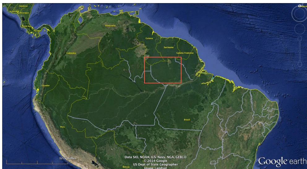
Mapa (1) da Área Etnográfica Tarumã-Parukoto, localizada (no contorno laranja) na Amazônia Setentrional.