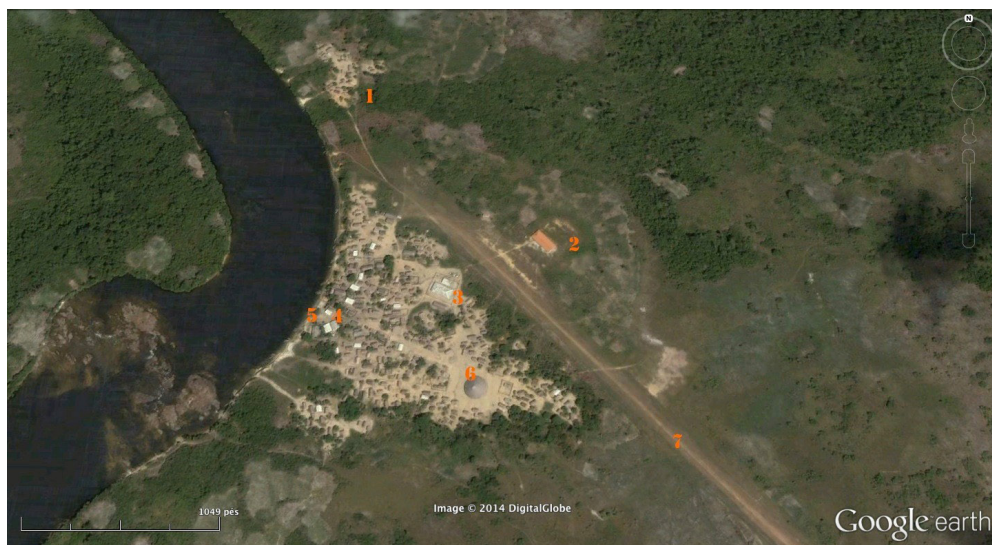
Mapa (5) da aldeia Mapuera: 1) “Bairro” Katuena; 2) Escola; 3) “Igreja”; 4) Posto de Saúde; 5) Posto da Funai; 6) Casa Grande (Umaná); 7) Pista de Pousou.

Mapuera, sempre possuíram roças separadas, relativamente distantes da aldeia, que funcionavam como uma espécie de “aldeia temporária”. Ali, mantinham uma relativa independência, passavam boa parte da vida cotidiana e elegiam seus locais de caça e coleta. Dessa forma, tais subgrupos puderam desfrutar de uma espécie de “autonomia” do grupo local, sem se submeter aos caciques gerais da aldeia Mapuera, ao seu ritmo coletivo e supraétnico, no qual a identidade maior, denominada Waiwai, mantinha-se como inibidora das diferenças e das “identidades” específicas dos subgrupos. Ou seja, a aldeia Mapuera, nesse caso, funcionou (e ainda funciona) como aldeia central (e as roças, como aldeias satélites), lugar de convergência para as atividades coletivas — em geral, de conteúdo ritual ou político —, onde os cultos evangélicos têm um papel preponderante.