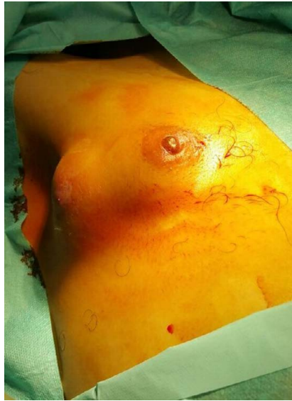
Figura 1 Sobre la pared del hemitórax derecho se palpaba una tumoración de unos 6x4 cm de consistencia blanda, dolorosa con signos inflamatorios, y fistulosa a la piel.