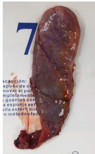
Figura 3 Destechamiento laparoscópico del quiste, colecistectomía laparoscópica anterógrada, resección de quiste.

alta con resultado de patología que reporto pared del quiste compuesta de revestimiento de epitelio cuboide rodeado de capas de tejido conectivo que pueden contener numerosos elementos celulares hepáticos.