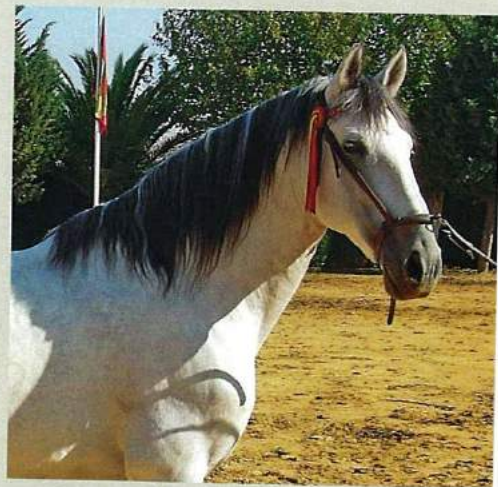
TRIANERA III 190101000700201 (1952)

De capa torda, posee buena inserción del cuello y cara muy racial. Caballo que destaca por su gran físico y alzada, con excelente funcionalidad.