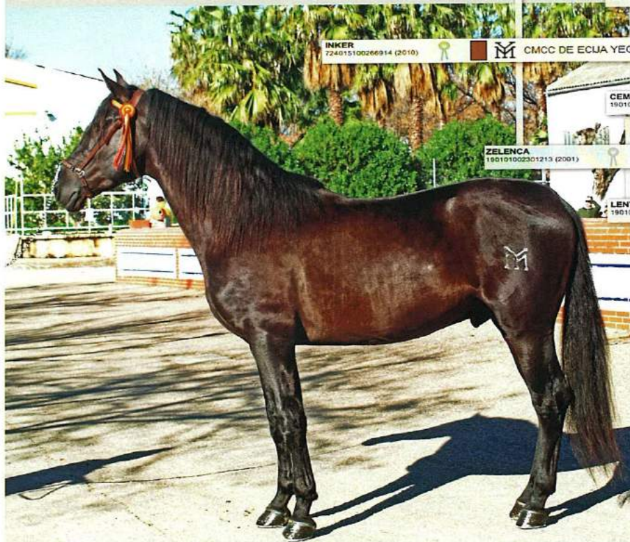
INKER 724015100266914 (2010) CMCC DE ECJA YEGUADA

Semental negro nacido en 2010 en la Yeguada Militar de Écija. INKER se caracteriza por tener excelentes cualidades para el deporte, con físico importante, gran estructura ósea y buen carácter.