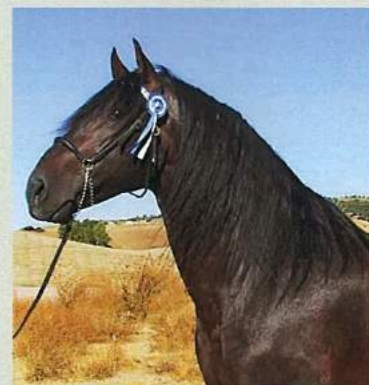
MAYORDOMA II 1991000900426 (1956)