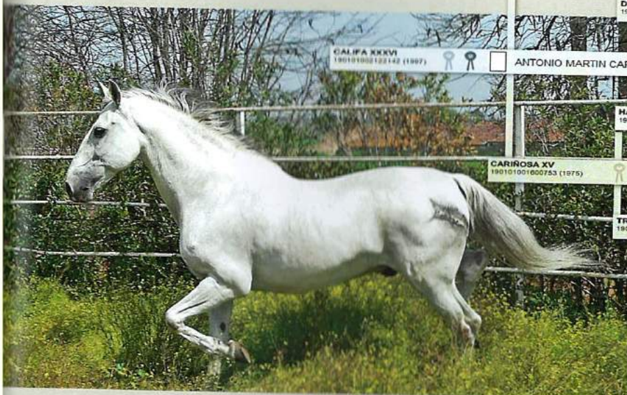
CALIFA XXXVI 190101001100142 (1997)