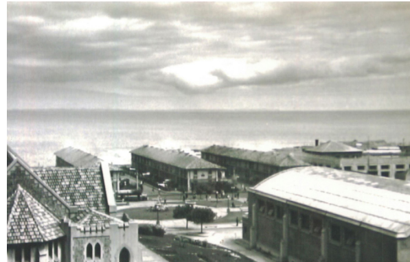
Figura 11. Vista de la plaza desde Cerro Palomares. En primer plano se observan la iglesia y las ruinas del gimnasio, y al fondo el mar.