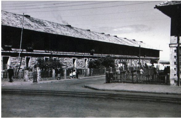
Figura 2. Una vista de los pabellones obreros en Puchoco (demolidos en los años ochenta); fotografía capturada en 1945.