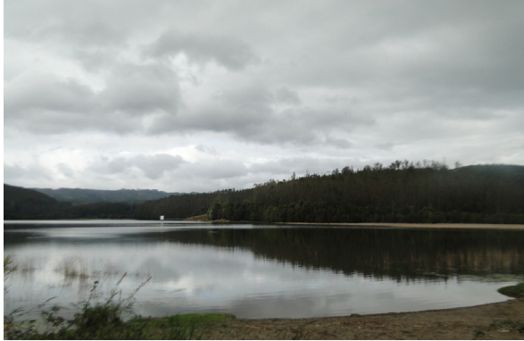
Figura 8. Vista de la laguna de Quiñenco.