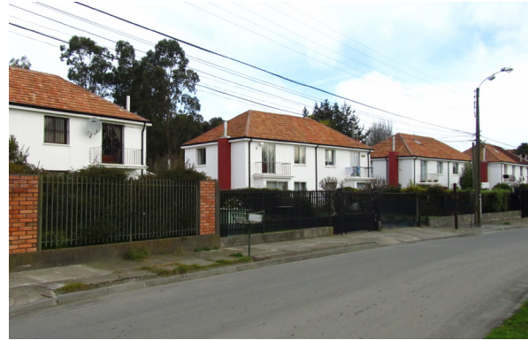
Figura 3. Las viviendas pareadas para empleados en Maule.