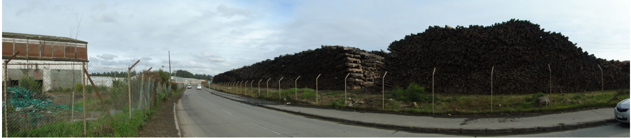
Figura 4. Vista del camino que conecta Puchoco y Maule. Se observa la vista del mar bloqueada por las pilas de madera de la compañía Cabo Froward Shipping Company. Fuente: las autoras, julio 2014.