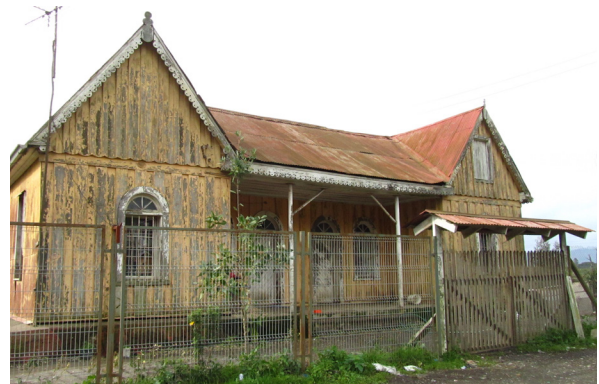
Figura 7. El area de "La Bomba". Podemos ver las ruinas de la casa donde vivía la familia del cuidador de la bomba que proveía de agua al sector. julio 2014