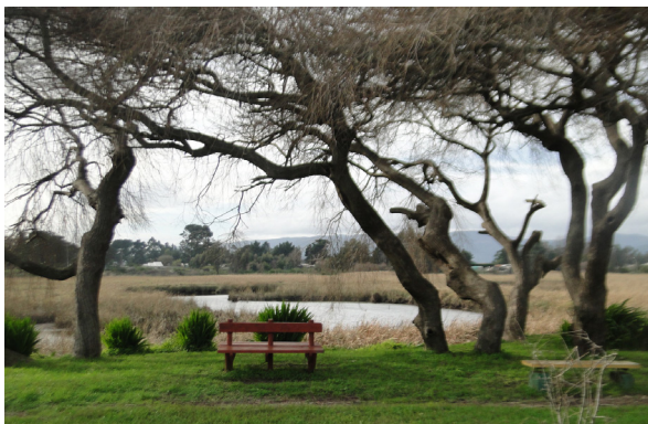
Figura 6. Vista de la desembocadura del Estero Maule.