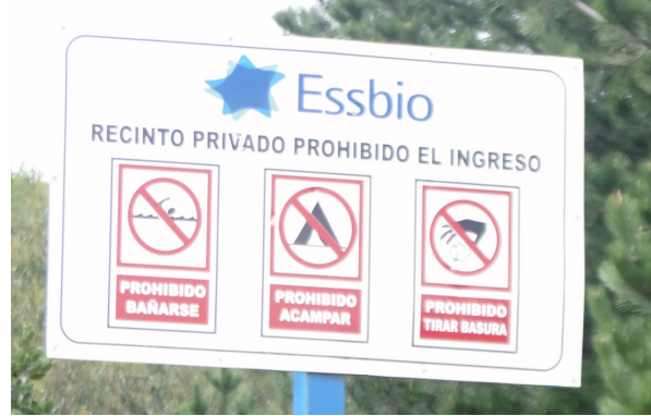
Figura 9. Letrero de la compañía de agua ESSBIO, prohibiendo el acceso a la laguna. uente: las autoras, julio 2014