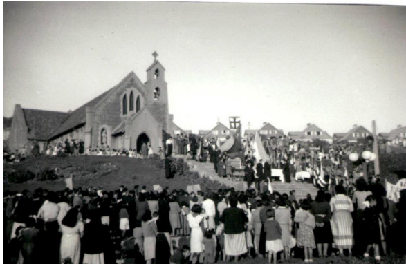
Figura 10. Vista de la iglesia desde la plaza.