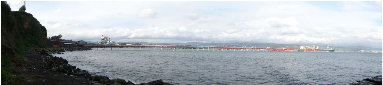
Figura 5. Vista de la Playa de Talca. Esta playa solía ser una importante area de recreacion durante el periodo minero. Al momento de la redacción de este artículo era utilizada como area de embarque por la compañía Cabo Froward Co.