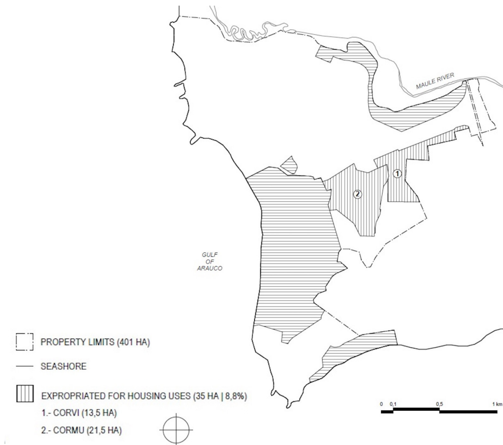
Figura 12. Proceso de venta de terrenos a fines de los setenta. Dibujo: A. Bustos

porque son dueños del terreno". Y "nadie se quejó", añadieron los residentes.