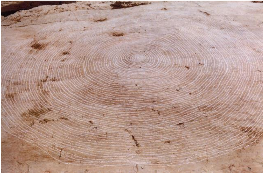
Imatge 3. F. Padrós (2001), Espiral II [guix sobre pedra, 300 × 300 cm (aprox.)]. Intervenció al riu Ter, Montesquiú.