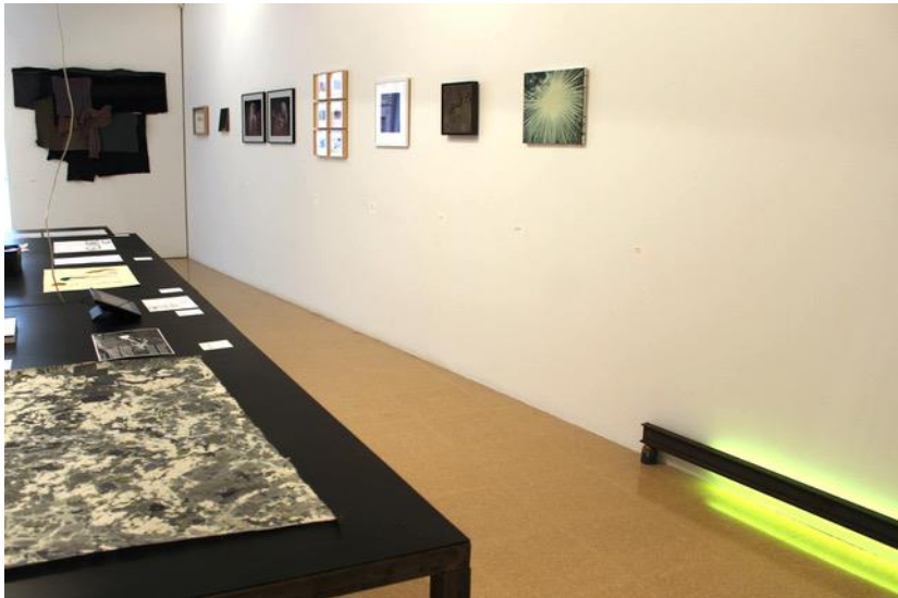
Imatge 4. Vista de l'exposició «Dibuixar el temps» (2020) a l'ACVIC, Centre d'Arts Contemporànies, Vic.