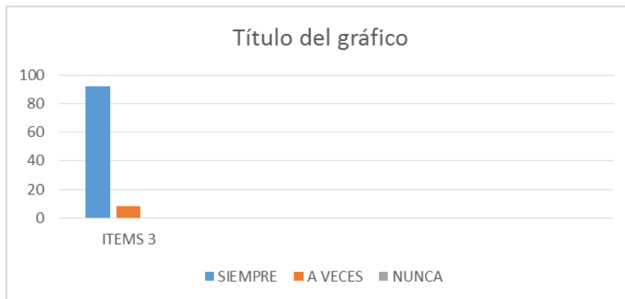
Gráfico3. Frecuencia porcentual de respuestas al ítem N° 2