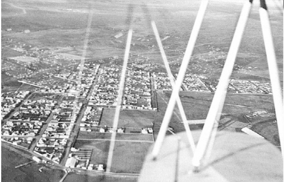
Figura 3: Vista aérea de Puerto Natales.