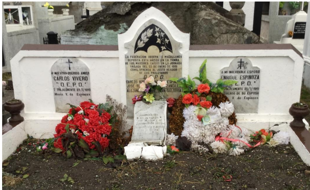
Figura 5: Tumba de obreros en cementerio Padre Hurtado de Puerto Natales.

-Cementerio Padre Hurtado, calle Esmeralda. Primer cementerio de Puerto Natales, aquí se encuentra la sepultura colectiva de los obreros muertos en la Huelga de 1919 y el panteón de los Carabineros caídos en acción en la misma refriega.