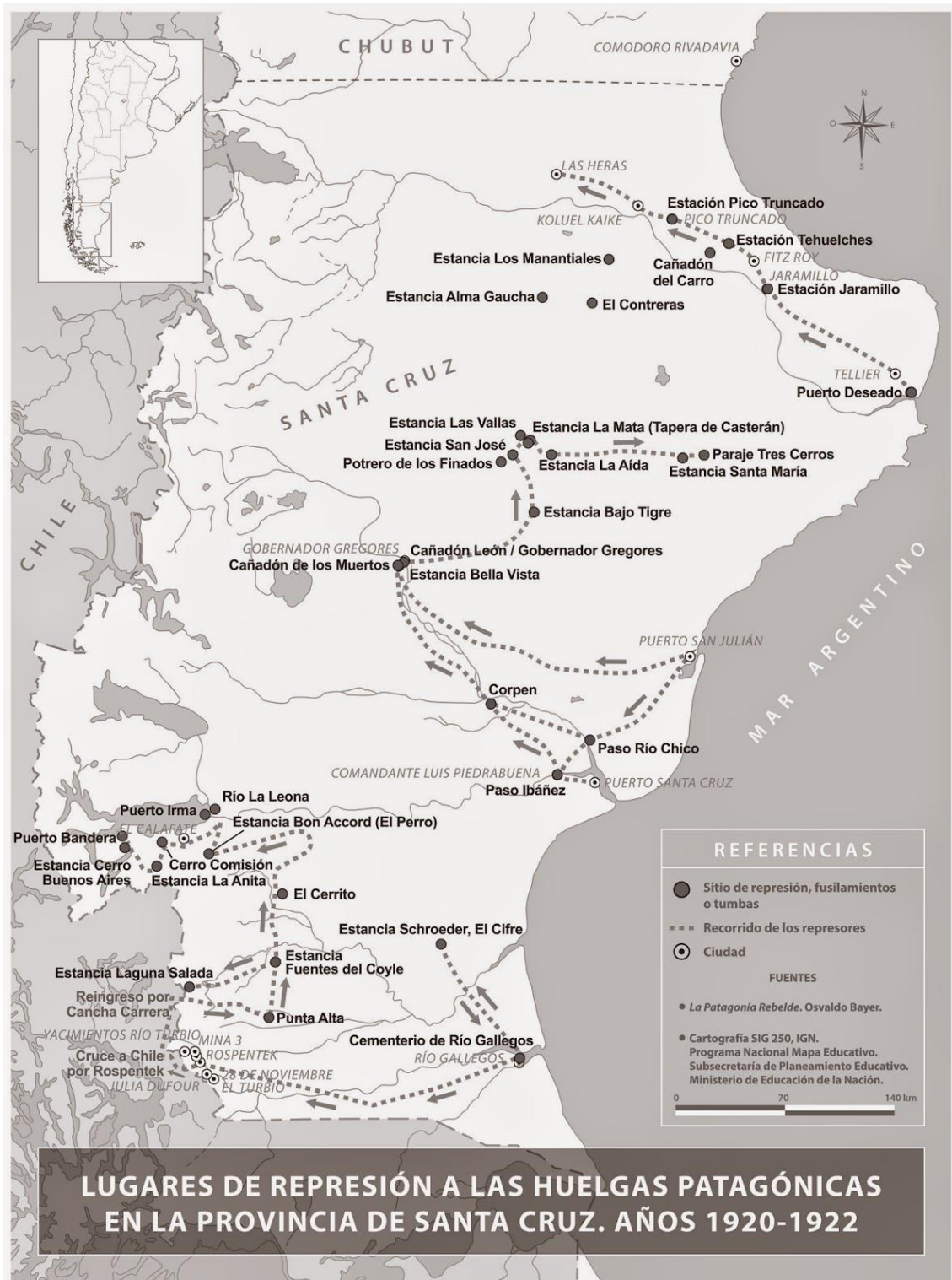
Figura 6: Mapa de los lugares de la Patagonia Rebelde.