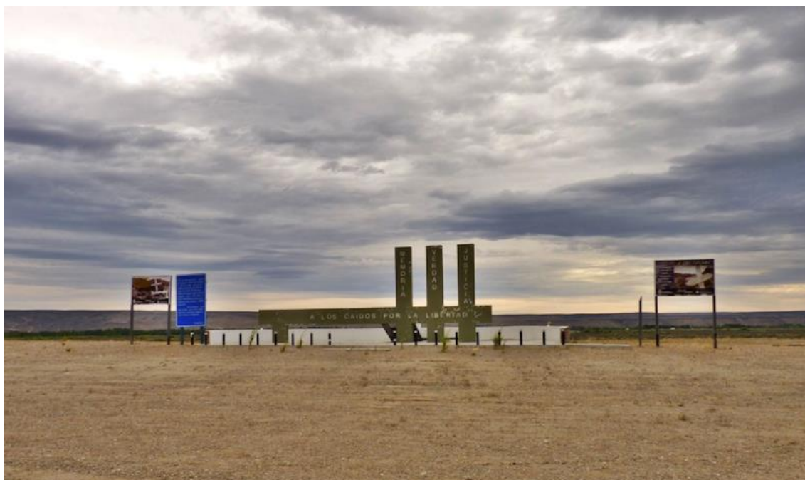
Figura 8: Cenotafio del “Cañadón de los muertos”, Gobernador Gregores.