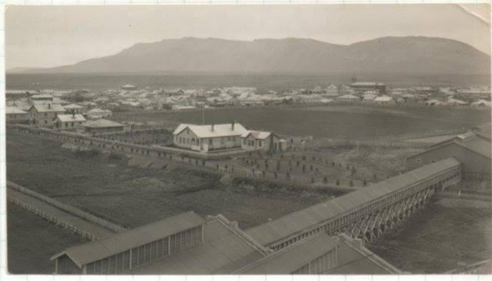
Figura 1: Vista aérea del Frigorífico Natales.