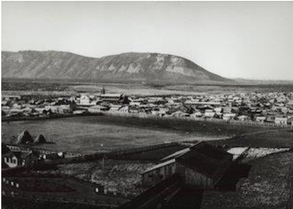
Figura 2: Vista aérea del Frigorífico Natales.