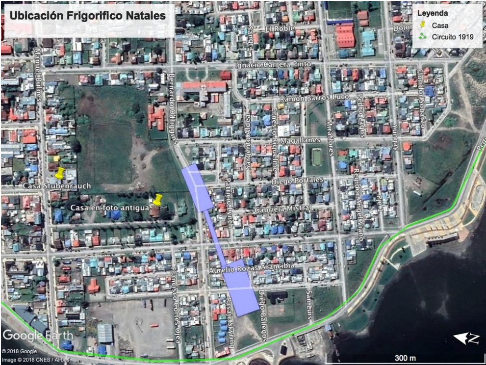
Figura 4: Reconstrucción de la ubicación del Frigorífico Natales.