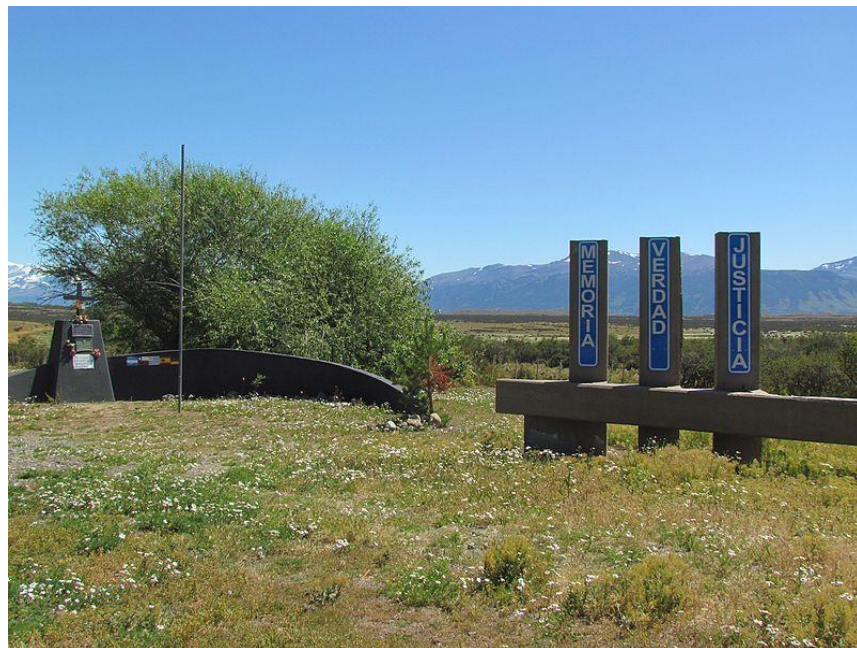
Figura 7: Monumento a los huelguistas de la Patagonia rebelde ubicado en la entrada a la estancia Anita.

En convenio con el Archivo Nacional de la Memoria se está trabajando específicamente el caso de los fusilamientos de la Estancia Anita, en este lugar ubicado a 40 km de Calafate, se encuentra un cenotafio construido hace más de una década por el municipio, y que fuera señalado como Sitio de la Memoria por el Archivo Nacional de la Memoria en el año 2010.