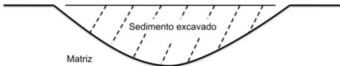
Imagen 1: Siguiendo la línea que divide los sedimentos. (Adaptado de Simonetti, 2009).

Claramente en este contexto encontrar y ver no son usados en su sentido usual. ¿Cuál sería el punto de tratar de encontrar lo que ya es visible, sabiendo que una vez presente ante los ojos indica que ya ha sido encontrado? El comentario de la estudiante da cuenta de una paradoja relacionada con una imposibilidad de ver lo invisible. Comparado con los novicios, los expertos no experimentarían dicha paradoja, en tanto serían capaces de ir más allá de las tensiones entre lo conocido y lo desconocido impuestas por ella. Las habilidades de excavación que los expertos despliegan en su quehacer dan cuenta de una capacidad que podríamos describir simplemente como la capacidad de sentir más allá . Comparado con el novicio, el experto podría proyectarse a lo desconocido, anticipando sensorialmente lo que está oculto. Sería capaz de ir de aquello que está aquí, a aquello que emerge allí.