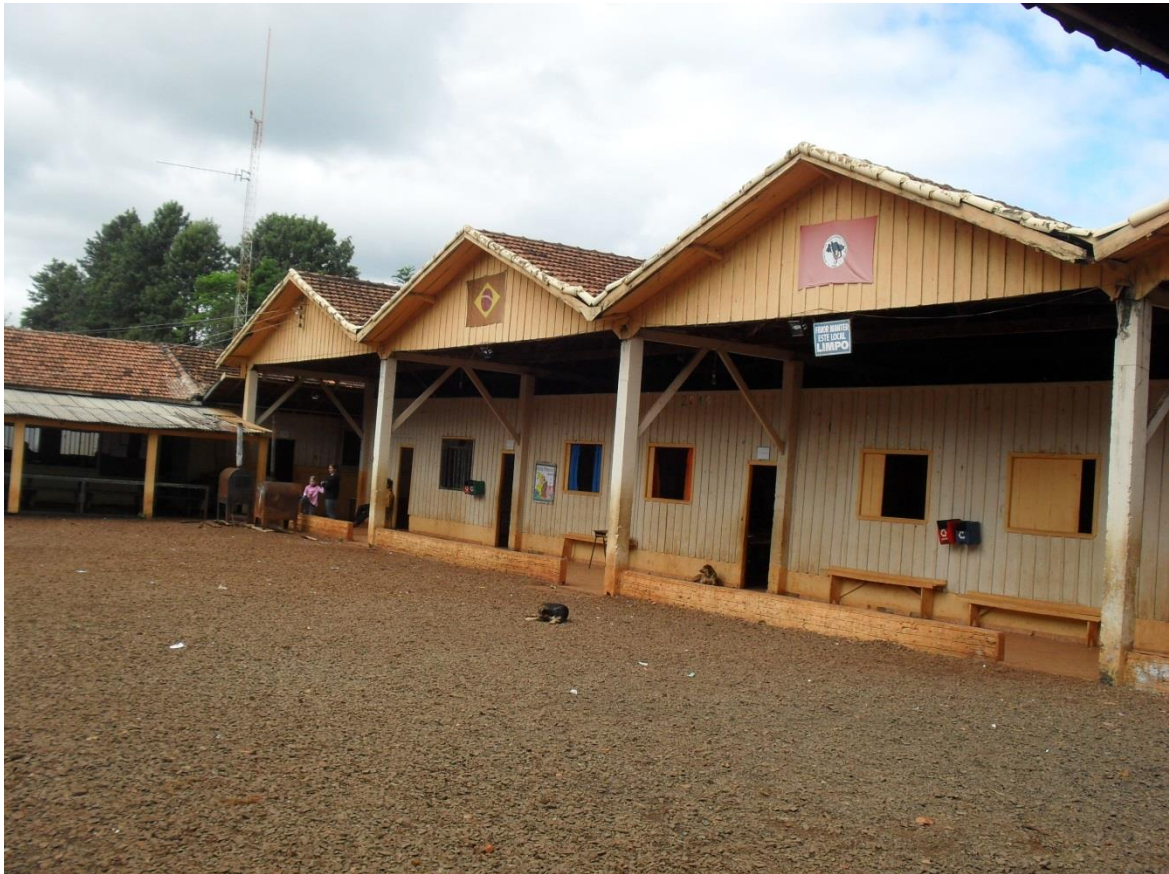
Figura 01: Escola Municipal José Clarismundo Filho e Colégio Rural Estadual José Marti.