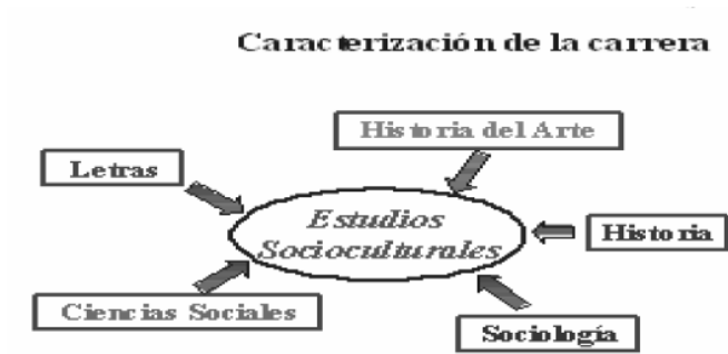
Cuadro 1. Integración de perfiles en la Licenciatura en Socioculturales. Tomado de Presentación de la Carrera al Consejo Nacional .

Como parte esencial del proceso formativo, el diseño curricular traza el modelo a seguir y proyecta la planificación, organización ejecución y control del proceso, que en el caso objeto de estudio se complejiza ya que se asimilan diversos modelos pedagógicos, lo que constituye de hecho un problema para adecuar correctamente el perfil del profesional siguiendo las leyes del diseño curricular.