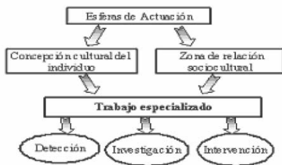
Cuadro 3. Esferas de actuación del egresado. Tomado de Presentación de la Carrera al Consejo Nacional.