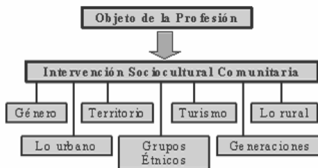
Cuadro 2. El objeto de la profesión. Tomado de Presentación de la Carrera al Consejo Nacional.

En el perfil del profesional de la Licenciatura en Estudios Socioculturales se refleja con claridad la amplitud de su perfil en los diversos problemas profesionales que debe resolver, entre otros, el trabajo social comunitario, la investigación, la docencia, la asesoría y la promoción cultural. Se establece a partir de ello el objeto de la profesión. (Cuadro #2).