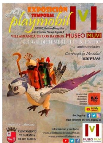
Fig. 3. Exposición temporal “PlayMuvi”.