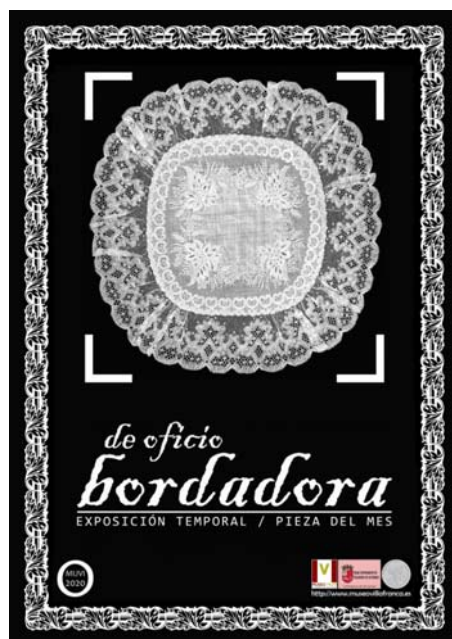
Fig. 5. Exposición temporal “De oficio bordadora”.

La exposición reúne una selección de bordados compuesta por más de un centenar de piezas de diversas técnicas y estilos, destinadas a un uso doméstico (juegos de sábanas, toallas, pañuelos, etc.), religioso-litúrgico (manteles para el altar, faldones y mantos para las imágenes religiosas) y civil (como la bandera del Ayto. de Villafranca). Esta muestra se completa con fotografías, documentos, diplomas-premios, instrumentos de costura y rincones que recrean los escenarios cotidianos de este oficio.