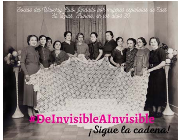
Fig. 6. Campaña “De invisible a invisible” de la Fundación Consejo España – EEUU.

Yuste y el Consorcio Museo Etnográfico Extremeño "González Santana" de Olivenza, que ya trabajan para sumarse a la campaña.