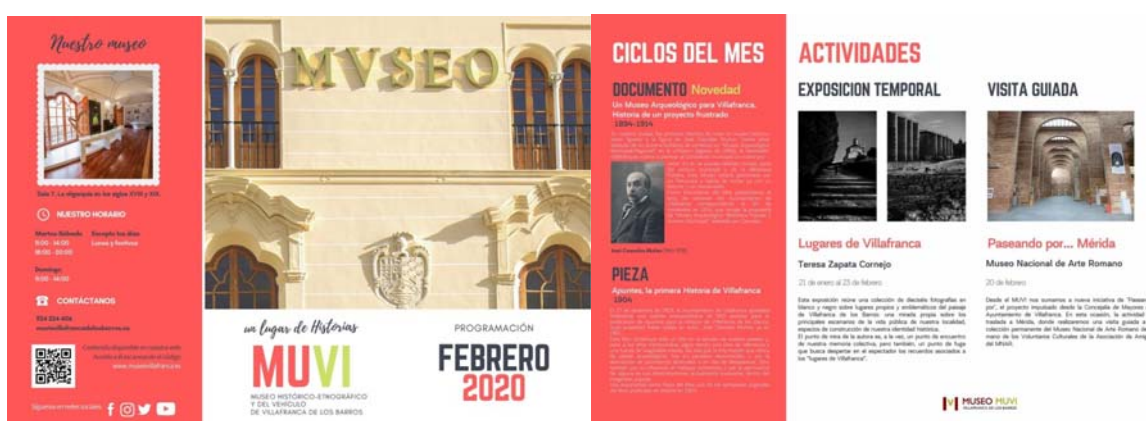
Fig. 1. Programación del mes de febrero.

www.museovillafranca.es/27_programacion_del_mes.html