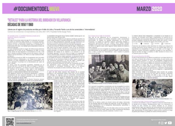
Fig. 2. Documento del mes de marzo.

http://www.museovillafranca.es/07_pieza_del_mes.html