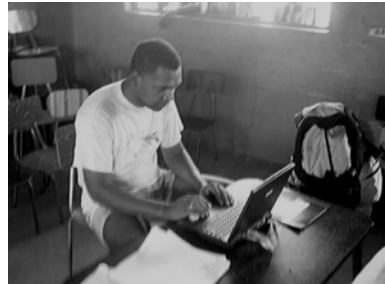
Fotografía 5, 6 y 7. Proceso de registro de los participantes.