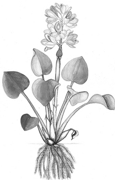
Figura 1. Vista de la planta acuática Eichhornia crassipes

Es originaria de Sudamérica tropical sin embargo se ha naturalizado en diversas regiones cálidas del globo (Centro América, América del norte, África, India, Asia, Europa, Australia y Nueva Zelanda) expandiéndose rápidamente a través de los cuerpos de aguas internos, bahías costeras de agua dulce, lagos y ríos (OEPP/EPPO, 2008).