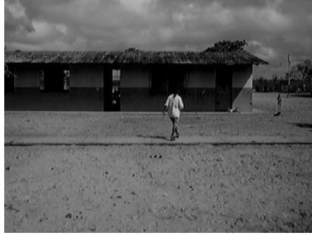
Fotografía 1. Lugar donde se realizó la capacitación.

Tres días antes del inicio de la capacitación se realizó la recolección de la bora, jornada que fue realizada en el caño macareo cerca de la comunidad. Posteriormente se realizó el proceso de selección y secado de la bora (Fotografías 2, 3 y 4).