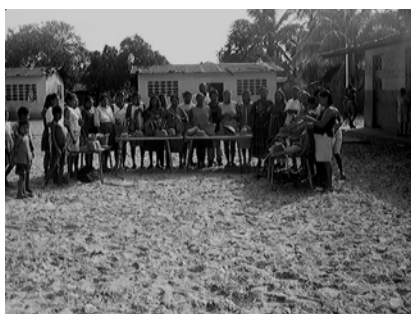
Fotografías 8, 9, 10, 11, 12, 13, 14, 15 y 16. Aplicación del método aprendiendo haciendo , productos artesanales elaborados y clausura de la capacitación.