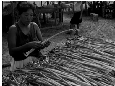
Fotografía 2, 3 y 4. Proceso de selección y secado de la bora.