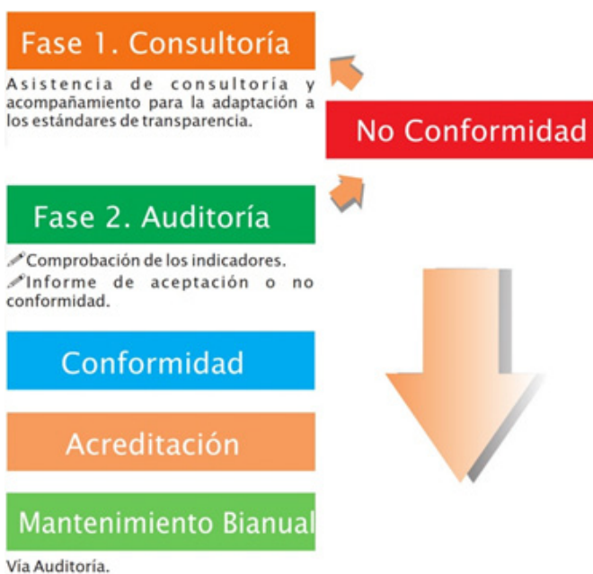
Gráfico 4. Pasos hacia la certificación.

El informe de diagnóstico de esta fase distingue entre las recomendaciones de mínimos, que son aquellas imprescindibles para mantener una candidatura sólida a la obtención de la certificación y las recomendaciones de mejora, que suponen un paso más allá del estándar que establece el sistema.