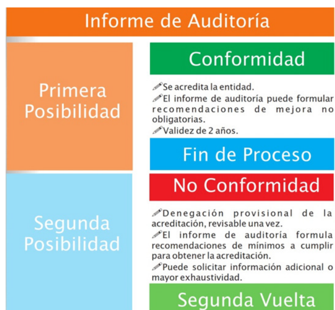
Gráfico 5. Consecuencias de la auditoría.

El auditor utiliza como base la propuesta de medición formulada por el consultor, chequeando la misma y realizando las correcciones y ajustes que correspondan atendiendo al contenido sustantivo de los indicadores y al nivel de exigencia que se establece para cada uno. A partir de aquí, el auditor emite informe diferenciando entre dos posibles situaciones: