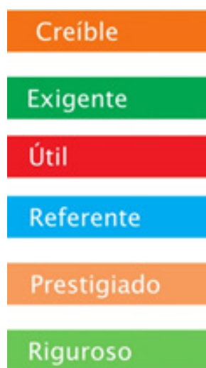
Gráfico 1'. Atributos del sistema.

a. La formación. Las actividades formativas y de reciclaje son la vía de entrada al sistema de acreditación a los profesionales que desean ejercer su actividad en esta materia y adquieren una verdadera relevancia por cuanto la superación de una prueba selectiva es requisito indispensable para obtener la habilitación como consultor y/o auditor de transparencia.