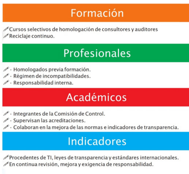
Gráfico 3. Detalle de los elementos del sistema.

Aparte, se menciona como un pilar adicional a las entidades interesadas en acreditarse y que son objeto de los procesos de diagnóstico, adaptación, auditoría y, en su caso, certificación. Aunque el sistema estaba inicialmente orientado hacia organizaciones públicas o parapúblicas, se ha diseñado de manera versátil, permitiendo su aplicación a entidades como los Colegios Profesionales, organizaciones empresariales, sindicatos y empresas privadas, entre otras.