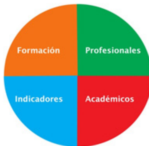
Gráfico 2. Pilares del sistema.

El ejercicio de los consultores y auditores dentro del sistema está sometido a una serie de incompatibilidades para asegurar la neutralidad e independencia de las labores que se desarrollan, especialmente los auditores quienes se rigen por unas normas deontológicas para evitar conflictos de intereses y situaciones análogas.