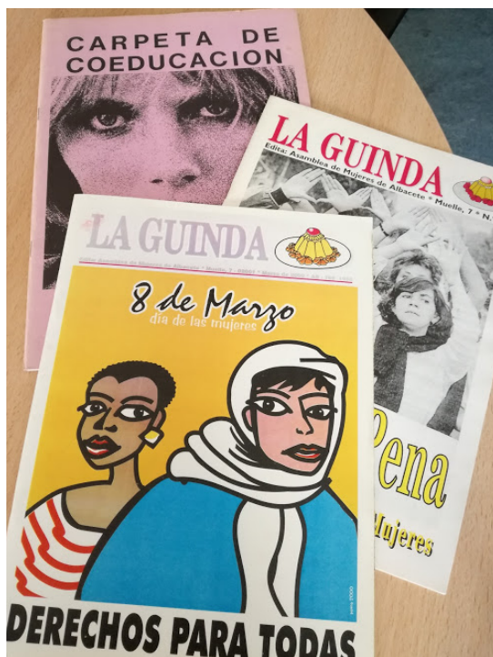
Publicaciones de la Asamblea de Mujeres: Carpeta de Coeducación (material didáctico) y dos ejemplares de la revista “La Guinda”.

Otras actividades que contribuían a transmitir la imagen del grupo 14 y del feminismo organizado fueron dos eventos culturales que mantuvieron cierta continuidad: la elaboración de la revista “La Guinda” durante varios años y el programa “La eterna cuestión” que se emitió en la radio libre Radio Karacol durante varios meses. En ambos se intentó que la crítica al machismo de la sociedad fuera presidida por la ironía y un toque de humor.