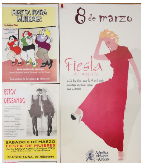
Carteles de invitación a la "Fiesta de Mujeres" que la Asamblea de Mujeres celebró durante más de dos décadas con motivo del 8 de marzo, día internacional de la Mujer.