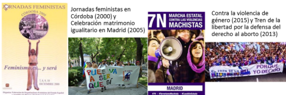
Movilizaciones feministas estatales a las que se sumó la Asamblea de Mujeres de Albacete

La Asamblea de Mujeres de Albacete se vinculó a la campaña por el derecho al aborto que impulsó la coordinadora de organizaciones feministas y en la que iba implícita la lucha por la educación sexual, el acceso a los métodos anticonceptivos y la libertad sexual. Se reclamaba la extensión de los centros de planificación familiar y la necesidad de que en ellos se atendieran las demandas de las jóvenes, aunque fueran menores de edad. La importancia de evitar embarazos no deseados y de prevenir abortos estaba en estos planteamientos pues siempre se fue consciente del sufrimiento de las mujeres que se embarazaban sin desearlo y decidían abortar. Durante años se facilitó información de clínicas de España y de Europa (Londres, Holanda) donde se podía interrumpir el embarazo con garantías, a las mujeres que lo solicitaban, tanto antes como después de la promulgación de la ley de despenalización parcial de 1985, lo que implicó alguna detención policial.