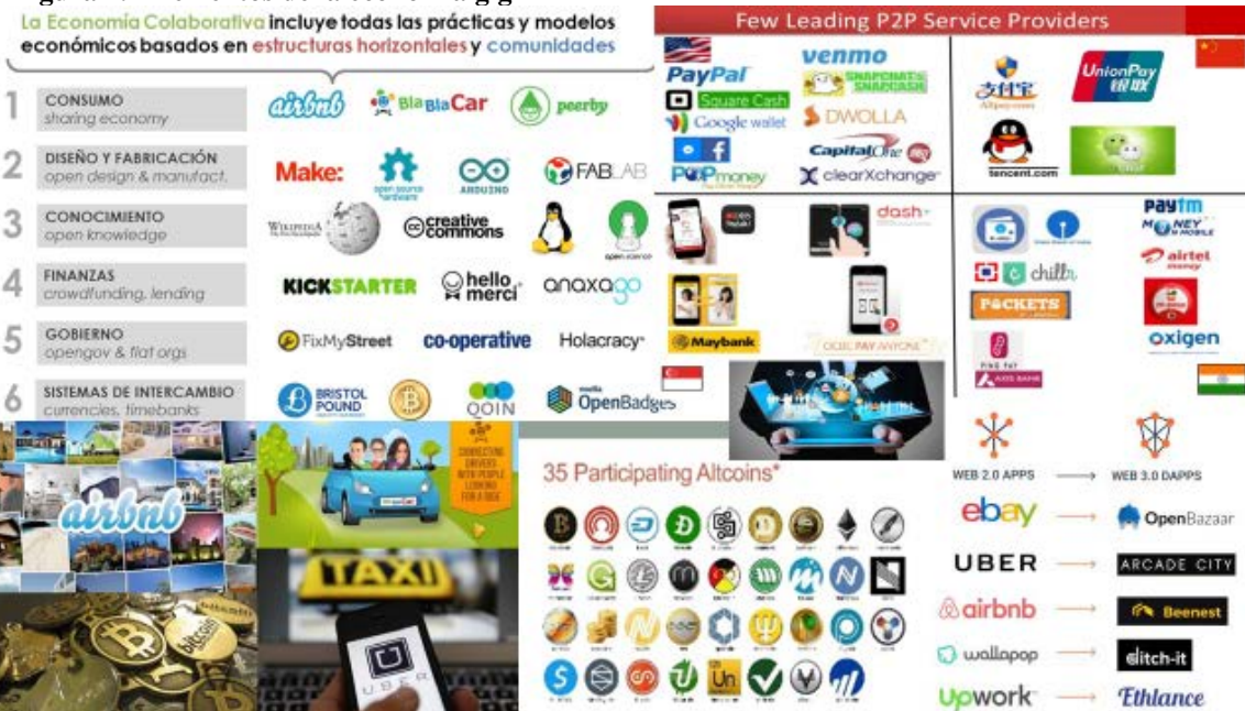
Figura 4.- Elementos de la economía gig

necesitan de los poderes públicos y sus fedatarios para la prestación y validación de bienes y servicios, sino que pasan a ser las propias comunidades de particulares quienes lo hacen, con recursos como las puntuaciones , comentarios y rankings , así como la tecnología blockchain (operativa a raíz de la crisis de valores de 2008). Ciertamente es que la tendencia de las redes sociales, plataformas y aplicaciones en las que se basa la economía gig, ha sido la de concentración (como ya pasara con las principales multinacionales en la EB, sirviendo el ejemplo de la industria musical –por continuar con la alusión a los bolos-, reducida a cuatro grandes conglomerados), dando lugar a relaciones de elefantes y hormigas (o sea de grandes compañías y cada uno de los profesionales), pero con la gran diferencia del potenciado influjo de la destrucción creativa (grandes cambios en poco tiempo, constante heurística y renovación tecnológica, etc.), por lo que periódicamente se van renovando los líderes de sector, así como los propios sectores.