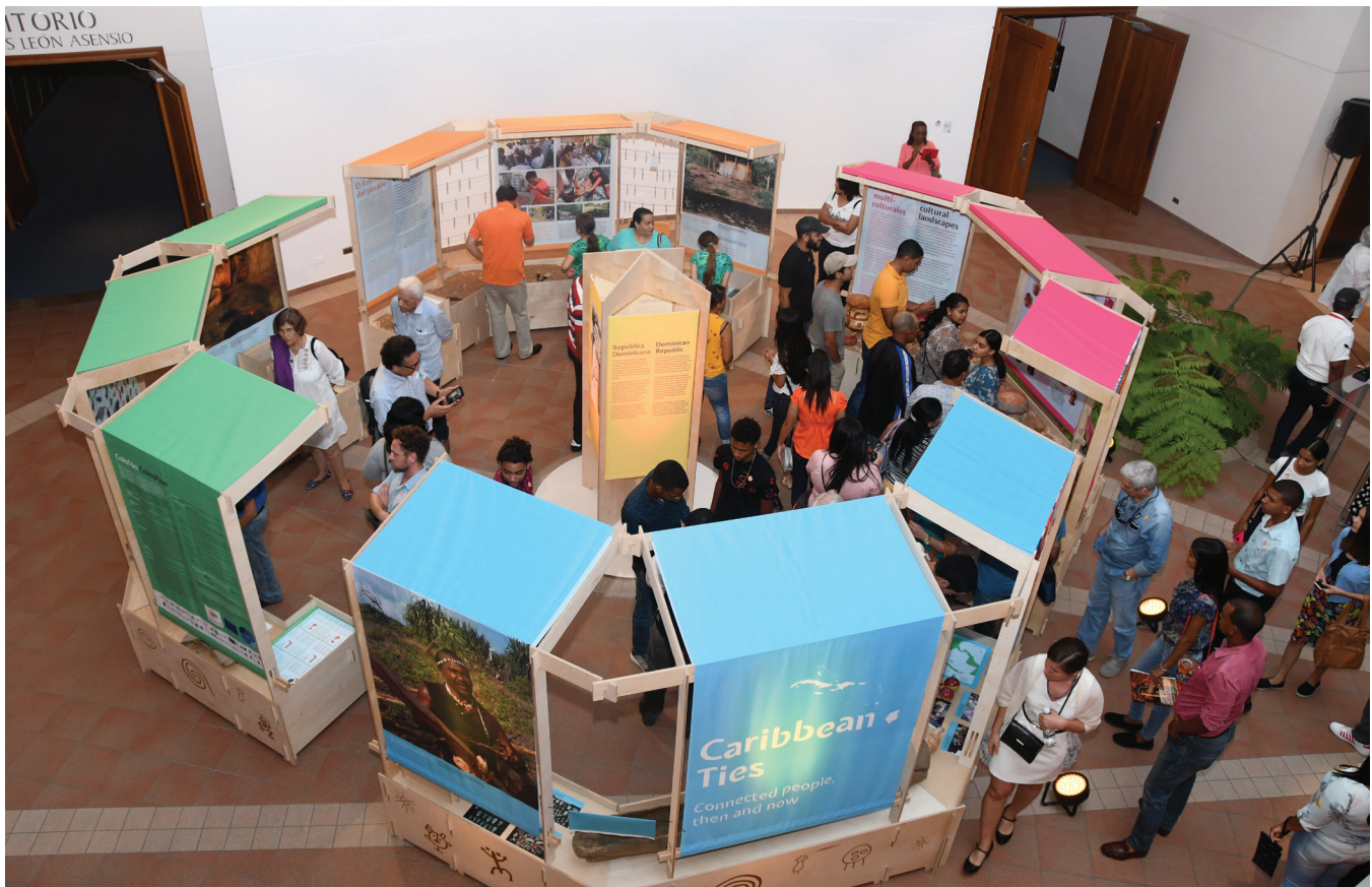
Figura 1. Inauguración de la exposición Lazos Caribeños en la sede del Centro Cultural Eduardo León Jimenes. República Dominicana.

locales y comunidades indígenas en todas las etapas de sus investigaciones; implementar una arqueología comunitaria y una práctica arqueológica descolonizadora a través del intercambio de conocimientos, programas educativos (e.g. Con Aguilar, 2019; Stancioff, 2018) y divulgación pública, entre los que resaltan, la organización de varios seminarios académicos (Ulloa Hung & Valcárcel Rojas, 2016; 2018), la exposición Lazos Caribeños , inaugurada en la sede del Centro Cultural Eduardo León Jimenes de República Dominicana y de manera paralela en varios países del Caribe, y el documental El retumbar del Caribe indígena producido por Pablo Lozano a partir de la colaboración científica y académica con el Instituto Tecnológico de Santo Domingo (INTEC).