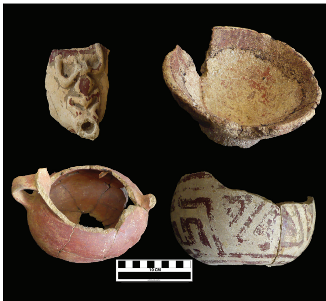
Figura 6. Vasijas con atributos de tradición indígena de la antigua villa española de Concepción de La Vega.