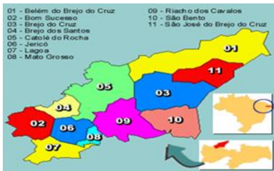
Figura 1. Microrregião de Catolé do Rocha-PB.

vegetação de caatinga típica do clima semiárido, é predominante na região central do Estado. A caatinga apresenta-se verde apenas nos meses em que ocorrem as chuvas de inverno. Suas árvores têm troncos grossos, tortuosos e com espessas cascas, folhas grossas e com espinhos (CITYBRASIL, 2013). Durante todo ano de 2012 a precipitação pluviométrica acumulada foi de 359 mm em apenas 7 meses de 2013, choveu mais que o dobro do ano anterior com cerca de 734 mm