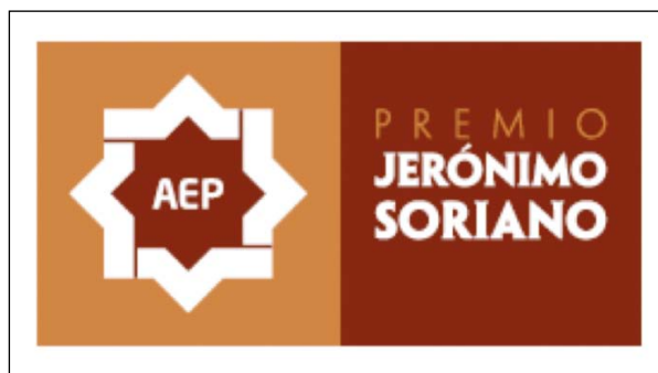
Figura 4. Anagrama Premio Nacional Internacional de la AEP «Jerónimo Soriano». El anagrama fue diseñado en la sede de la AEP.

En 2011, en el Congreso Nacional celebrado en Valladolid (junio) se inaugura esta nueva etapa (VI Premio). Los premiados acuden a Teruel en el curso del Memorial