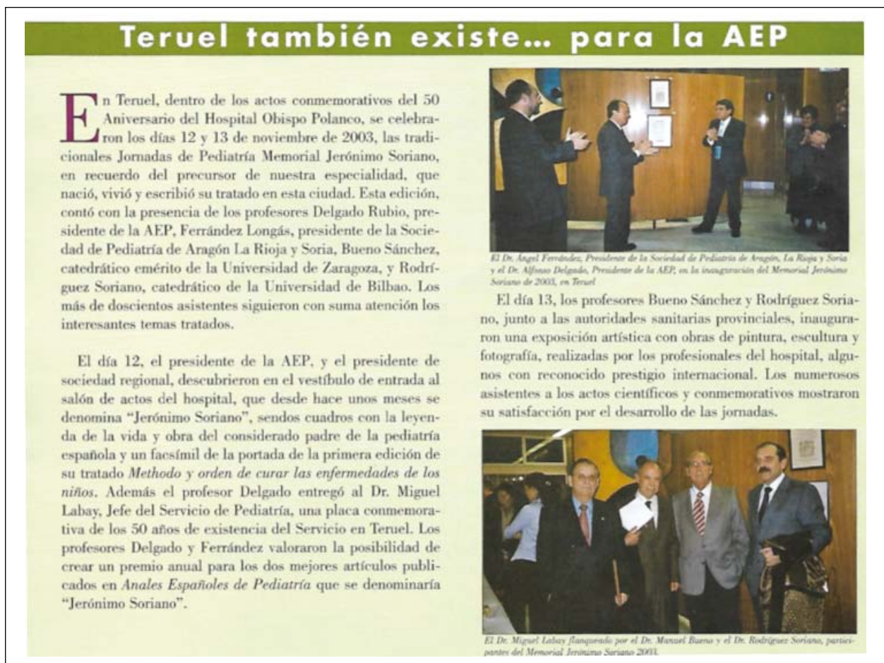
Figura 3. Memorial Jerónimo Soriano: X Edición (2003). Inicio Premios Jerónimo Soriano. Asistieron las dos figuras estelares de la Pediatría, desgraciadamente, desaparecidas.