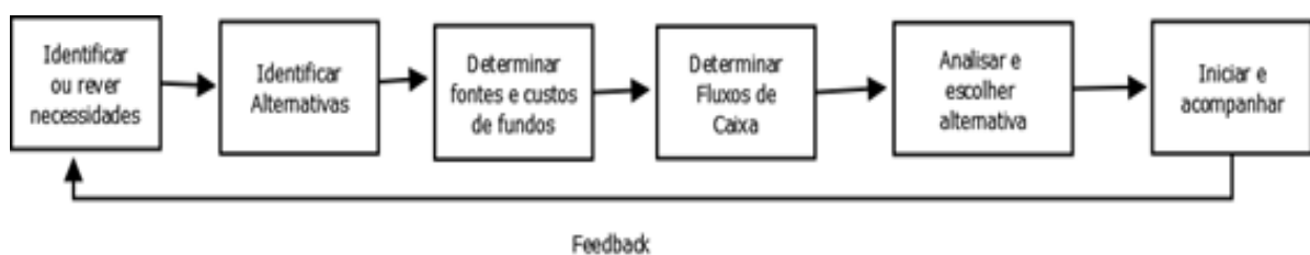
Figura 1 - Fluxograma do processo de análise de investimento de Capital