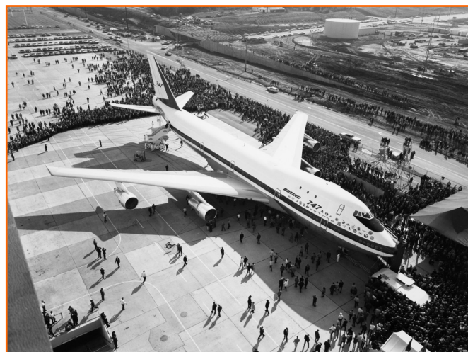
Fig. 1. Primera presentación pública del avión Boeing 747 el 30 de septiembre de 1968. SAS Scandinavian Airlines, imagen en dominio público. Disponible en: < https://commons.wikimedia.org/wiki/File:Boeing_747_rollout_(3).jpg >. [Fecha de consulta: 28 agosto 2017]

aéreo, hasta llegar al máximo actual de la tercera Jet Age , que está relacionado con la aparición de las aerolíneas low cost a mediados de los noventa (Davies, 2016).