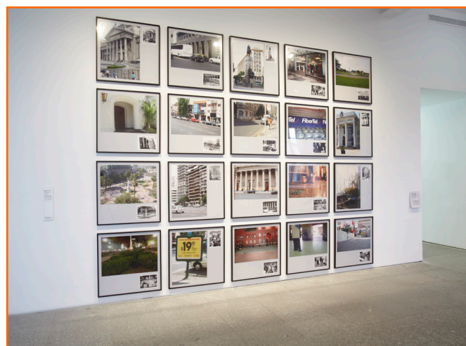
Fig. 3. Muntadas, Media Sites / Media Monuments: Buenos Aires , 2007. Vista de la exposición «Muntadas. Entre/Between» en el Museo Nacional Centro de Arte Reina Sofía (MNCARS) en 2011.

De los ejemplos anteriores se deriva que las características de la metodología de investigación artística establecida por Muntadas permiten flexibilizarla, adaptándola a casos concretos y a condiciones espacio-temporales específicas, según el proyecto. Su carrera internacional y su voluntad de deslocalización le aportaron un conocimiento amplio de diversos territorios que comparaba empleando recursos como los ya mencionados de la dicotomía , la serie y la movilidad a través de redes (de transporte o comunicación). La dicotomía permite comparaciones fuertes y simples de gran efecto epistémico, aunque el trabajo de Muntadas no se centre tanto en los extremos enfrentados como en los fenómenos fronterizos, en el espacio in-between entre conceptos. El modo repetitivo permite localizar patrones de un modo analítico-estructuralista. Durante del desarrollo de su trayectoria, el trabajo en series de Muntadas se vuelve poco a poco más complejo y llega a trabajar con series de series : un proyecto compuesto por la