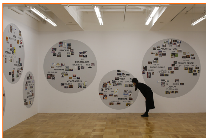
Fig. 4. Muntadas, Asian Protocols: Cartographies , 2014. Vista de la exposición «Muntadas. Asian Protocols» en el centro de arte 3331 Arts Chiyoda en 2016.

El listado de proyectos que pueda citarse es necesariamente incompleto, debido a la productiva trayectoria de Muntadas durante más de cuarenta años. Sin embargo, este artículo no pretende hacer una relación exhaustiva, sino poner el acento en la evolución de su modo de hacer investigativo. No han sido mencionados trabajos clave según la historiografía artística, los cuales, operando bajo su sistema de pesquisa, tratan de un modo novedoso conceptos importantes como lo genérico, 19 la censura 20 o la vigilancia. 21 A pesar de ello, es de esperar que la complejidad de la obra de Muntadas haya sido puesta de relieve, así como sus relaciones con la movilidad expandida de la Jet Age y la investigación artística.