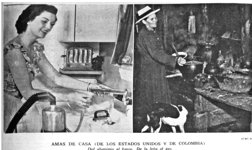
Figura 3. Amas de casa de los Estados Unidos y de Colombia, según los medios.

Fuente: “Cifras de avance”, Semana 380 (1954): 34-35.