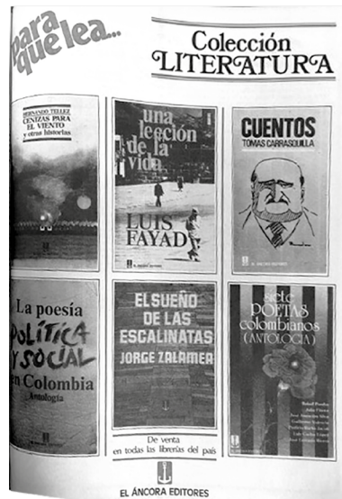
Figura 2. Publicidad en Magazine Dominical de El Espectador , mayo de 1985.