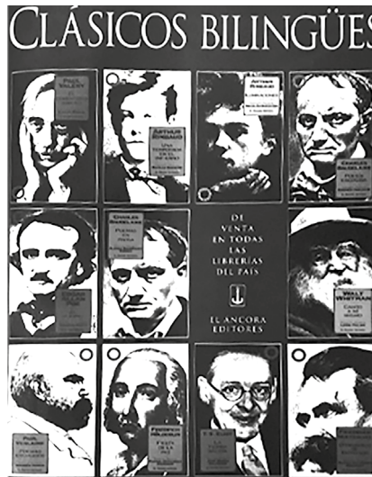
Figura 3. Publicidad en Magazine Dominical de El Espectador , abril de 1995.