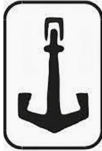
Figura 1. Logo de El Áncora Editores.