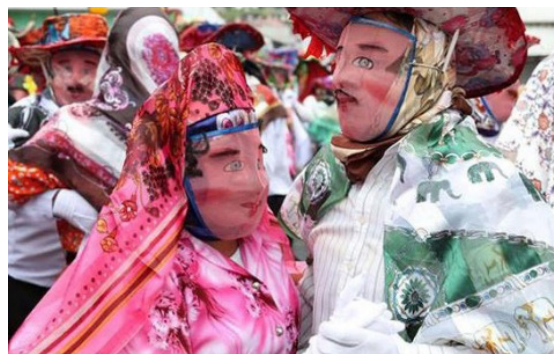
Figura 3: Comparsa con caretas: parejas de línea y capariche

La guaricha, de igual manera, tapa su rostro con pañuelos y caretas de alambre, como utilería puede llevar un acial, una cartera o un muñeco de felpa, ya sea de representación humana, animal o fantasía; este por lo regular es descuidado, sucio o desnudo. Por otra parte, el capariche, cubierto con careta de alambre y guantes blancos, lleva una escoba de gran tamaño confeccionada con retama negra y seca propia de la zona, sus dimensiones oscilan entre los 90 a 100 cm, la parte inferior y el palo que los sujeta de unos 50 cm llega a medir entre 140 a 150 cm; en ocasiones las decoran con cintas y flores. Las parejas de línea, hombres y mujeres, tienen un pañuelo blanco que lo agitan durante la danza, no poseen utilería, pero su coreografía es preparada por semanas antes de la festividad.