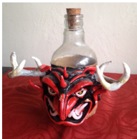
Figura 2: Botella del diablo (varios 2014). Colección: Colectivo La Minga