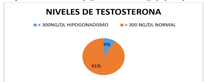
Grafica 3. Prevalencia de Hipogonadismo dentro el grupo participante

De los participantes 31 pacientes (21 %) tenían niveles de CD4 menores de 200 y el resto de pacientes; 118 (79 %) tenía niveles de CD4 por encima de 200.