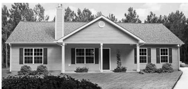
FIGURA 8. VIVIENDA UNIFAMILIAR ESTADUNIDENSE