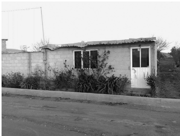
FIGURA 4. VIVIENDA RURAL CONSTRUIDA CON BLOCK DE CEMENTO EN LA MAGDALENA TÉTELA MORELOS

En un estudio, Howar (1973, p. 75) encuentra resultados similares a los obtenidos en la comunidad de estudio, respecto de que la mayoría de los hogares rurales presenta condiciones inadecuadas de ventilación, asoleamiento y de construcción; el baño está aislado y es precario; las instalaciones eléctricas, sanitarias e hidráulicas son inadecuadas o inexistentes, y el corral no está organizado. La casa la integran uno o más cuartos, sin privacidad funcional ni visual; tiene piso de tierra apisonada, vano de acceso principal, una o dos ventanas de dimensiones mínimas; en algunos casos, cuenta con un acceso en la parte trasera o lateral. A pesar de que este tipo de vivienda es modesta, responde, ante todo, a la formación del constructor, que se adapta a la naturaleza, a los recursos económicos y técnicos con que cuenta (Campos, 1987, p. 29), y está diseñada para adaptarse a las condiciones del clima y obtener cierto confort ambiental, además de responder a las actividades productivas de sus dueños (véase la figura 4).