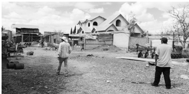
FIGURA 9. CONTRASTE DE VIVIENDA RURAL TRADICIONAL VS VIVIENDA CONSTRUIDA POR MIGRANTES EN LA MAGDALENA TÉTELA MORELOS