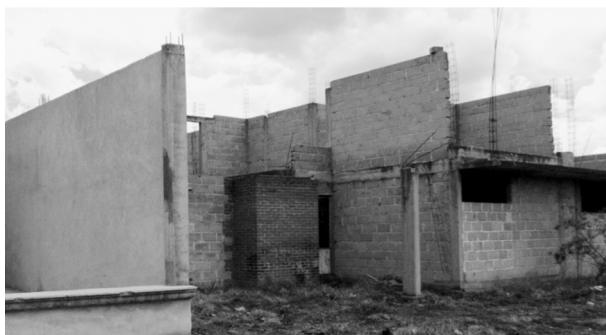
FIGURA 6. VIVIENDA RURAL MODERNA DE BLOCK DE CONCRETO EN LA MAGDALENA TÉTELA MORELOS

Otro tipo de vivienda encontrada es la construida por migrantes que, en el mejor de los casos, cuenta con un proyecto arquitectónico; está construida con mejores materiales que proveen más resistencia a la estructura; tiene instalaciones ocultas, dos plantas, delimitación en el exterior, pórtico de acceso principal y portón para acceso vehicular, zonificación de interiores, sistema constructivo de columnas y travesaños, losas a dos o cuatro aguas, muros exteriores e interiores con acabados finales, puertas de herrería diseñadas, ornamentación y vegetación natural (véase la figura 7). Usualmente, este tipo de vivienda construida por los migrantes internacionales es realizada sin la asesoría de un arquitecto. Los migrantes suelen mandar planos o fotografías de las casas que les gustaron en Estados Unidos, y practican una arquitectura de prueba-error (AECID, 2011, p. 10) que imita las típicas casas familiares en las que han trabajado, de arquitectura simple con una a dos plantas y superficie extensa (Boils, 2010b, p. 120) (véase la figura 8).