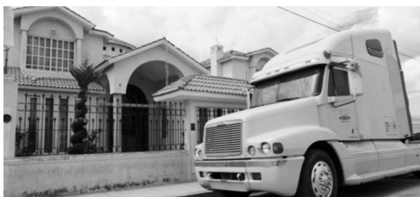
FIGURA 14. VIVIENDA CONSTRUIDA POR MIGRANTES EN LA MAGDALENA TÉTELA MORELOS