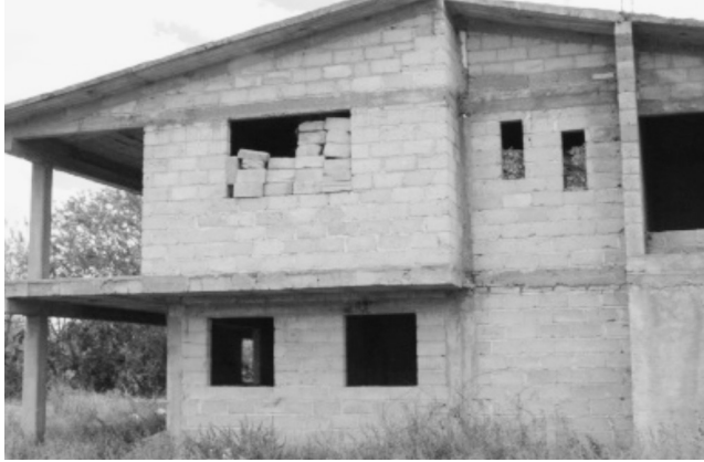
FIGURA 13. VIVIENDA CONSTRUIDA POR MIGRANTES SUB UTILIZADA COMO BODEGA EN OBRA NEGRA EN LA MAGDALENA TÉTELA MORELOS