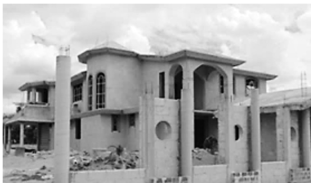
FIGURA 11. VIVIENDA CONSTRUIDA POR MIGRANTES ABANDONADA EN OBRA NEGRA EN LA MAGDALENA TÉTELA MORELOS

necesidades familiares y productivas. Ello tiene explicación en que sus moradores reciben influencias, en la fisonomía y la morfología de la vivienda, de los procesos de urbanización, el modo de vida urbano y la globalización (Banski y Wesolowska, 2010, p. 116). Este imaginario de vivienda no responde a las necesidades de vivienda. Aunque haya una diversificación de las actividades productivas, la vida cultural cambia con mayor lentitud (véanse la figura 10, figura 11, figura 12 y figura 13).