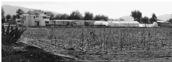
FIGURA 17. INTEGRACIÓN DEL ÁREA HABITACIONAL Y ÁREA PRODUCTIVA EN EL ESPACIO RURAL EN LA MAGDALENA TÉTELA MORELOS