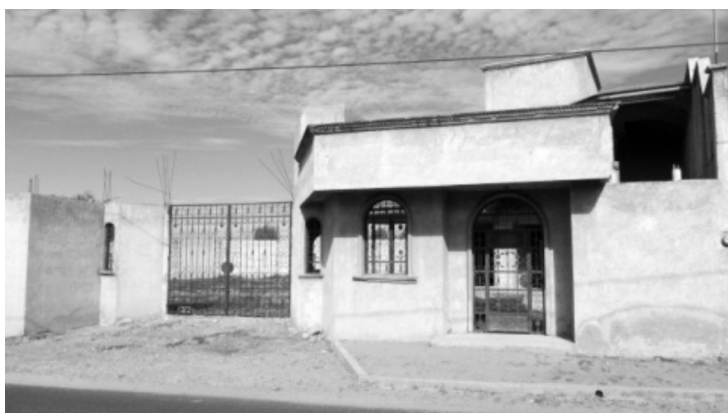
FIGURA 12. VIVIENDA CONSTRUIDA POR MIGRANTES ABANDONADA EN OBRA NEGRA EN LA MAGDALENA TÉTELA MORELOS