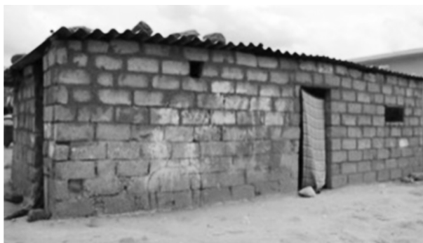
FIGURA 2. VIVIENDA RURAL DE ADOBE EN LA MAGDALENA TÉTELA MORELOS

el control y resguardo de los animales, ubicada dentro de la propiedad de manera desordenada y con mínima calidad constructiva. Este tipo de vivienda es modesta y precaria, producto de la pobreza en que vive la mayoría de la población rural del país.