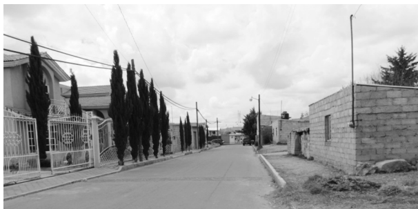
FIGURA 16. MODIFICACIONES Y ALTERACIONES DEL PAISAJE EN LA MAGDALENA TÉTELA MORELOS