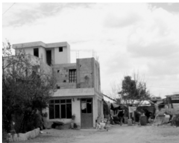
FIGURA 5. VIVIENDA RURAL RECONSTRUIDA O REMODELADA EN LA MAGDALENA TÉTELA MORELOS

combinada. En ocasiones, estas combinaciones no son funcionales del todo, como en el caso de los castillos de cemento con el adobe, que genera debilitamiento de la construcción (Guzmán y Guzmán, s/f, p. 5) (véase la figura 5).