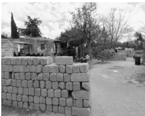
FIGURA 3. VIVIENDA RURAL Y DELIMITACIÓN DE LA PROPIEDAD EN LA MAGDALENA TÉTELA MORELOS