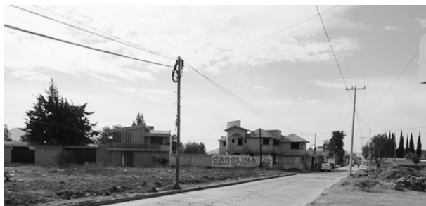
FIGURA 15. AVENIDA PRINCIPAL DE LA MAGDALENA TÉTELA MORELOS