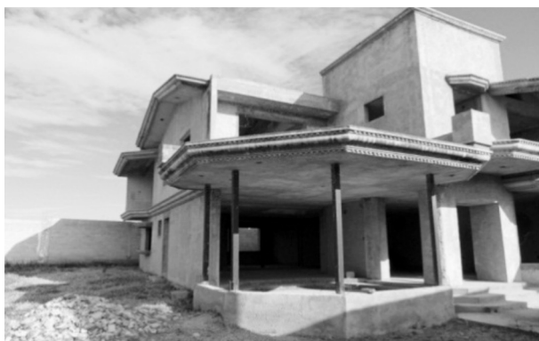
FIGURA 10. VIVIENDA CONSTRUIDA POR MIGRANTES INCONCLUSA EN LA MAGDALENA TÉTELA MORELOS

La vivienda rural de migrantes, por sus características de diseño arquitectónico, no necesariamente corresponde a las necesidades de los habitantes de esta comunidad. Por ello, están sujetas a ser subutilizadas o deshabitadas; en el mejor de los casos, a que se conviertan en bodegas, corrales o graneros, y otras quedan inconclusas. En La Magdalena Tetela Morelos se encontraron viviendas sin terminar, abandonadas o utilizadas como bodegas y corrales. Este tipo de vivienda debería corresponder a la reconfiguración rural de estos espacios, en donde las casas tienen ciertas características y con diferentes arreglos espaciales, no necesariamente acordes con las