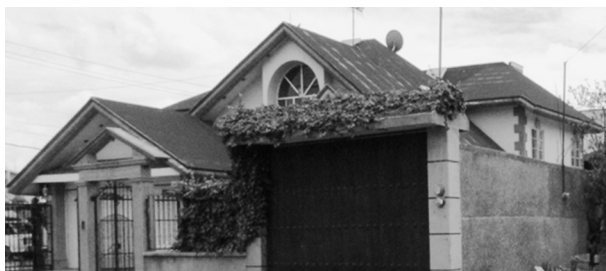
FIGURA 7. VIVIENDA MODERNA CONSTRUIDA POR MIGRANTES