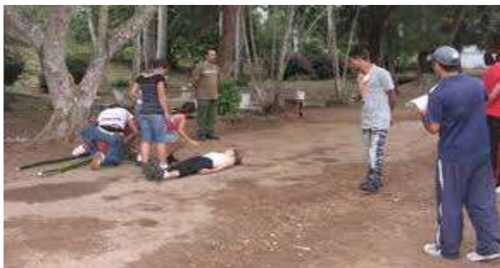
Fig. 5: Pioneros de la enseñanza primaria recibiendo la capacitación en el campus de prácticas junto con los profesores guías-bases.