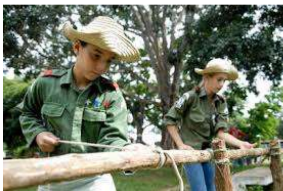
Fig. 1: Estudiantes exploradores de la enseñanza primaria mostrando sus habilidades en el Movimiento de Pioneros Exploradores, desde la Organización de Pioneros José Martí.

Las siguientes imágenes ejemplifican cómo los pioneros se implican, y participan desde la organización a ser también, más creativos, y que a su vez posibilita que el estudiante se capacite para desempeñarse como sujeto integral. El número de personas que participan en la organización en la provincia Sancti Síritus, de Cuba, cabe señalar que supera los 20 mil estudiantes de la enseñanza primaria, que es donde se aplica la experiencia, porque también en secundaria básica, existe este tipo de programa.