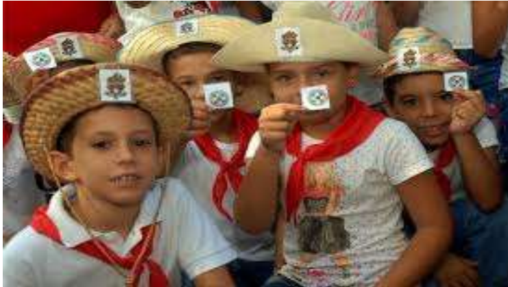
Fig. 3: Estudiantes de la enseñanza primaria mostrando el logotipo del Movimiento de Pioneros Exploradores, que es enseñarlos a sentir pertenencia por lo que defienden.