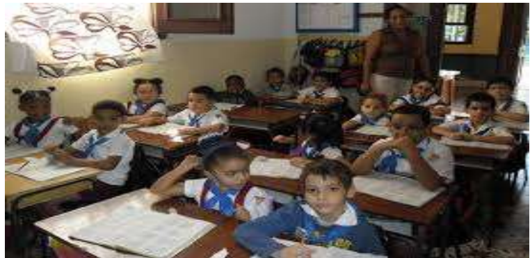
Fig. 4: Pioneros de la enseñanza primaria recibiendo la capacitación en el aula de clases.