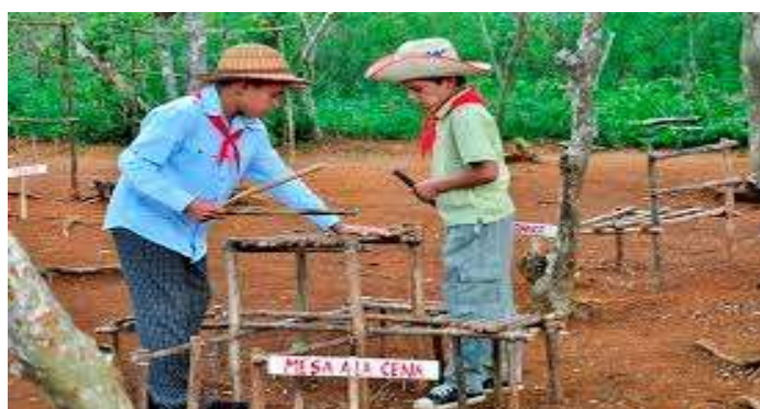
Fig. 2: Estudiantes exploradores de la enseñanza primaria construyendo una casa rústica.