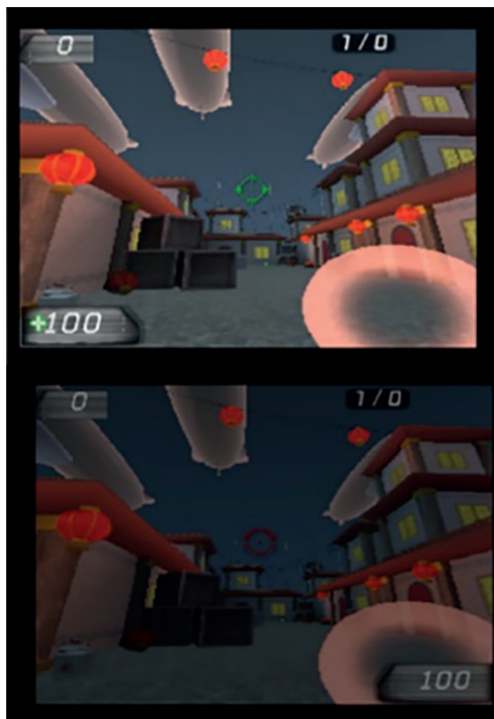
FIGURA 3. Principio biocular aplicado a un videojuego de acción, Magical Garden Game World

a desarrollar mecanismos con un enfoque binocular como alternativa para tratar la ambliopía, y se propone la implementación de películas o videojuegos utilizando este principio (48).