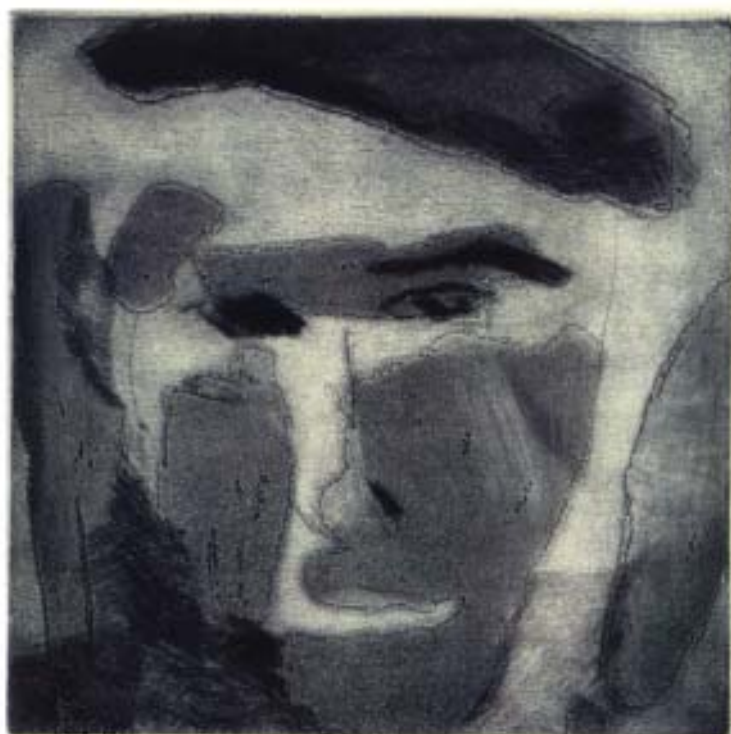
Diana Alitchison. Aguatinta/punta seca. 19,5x19,5 cm.