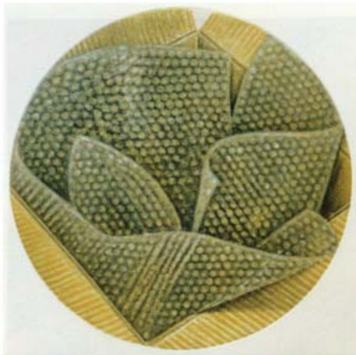
Anne Heyvaert. Embalaje. Aguatinta y punta seca. 176x56 cm.