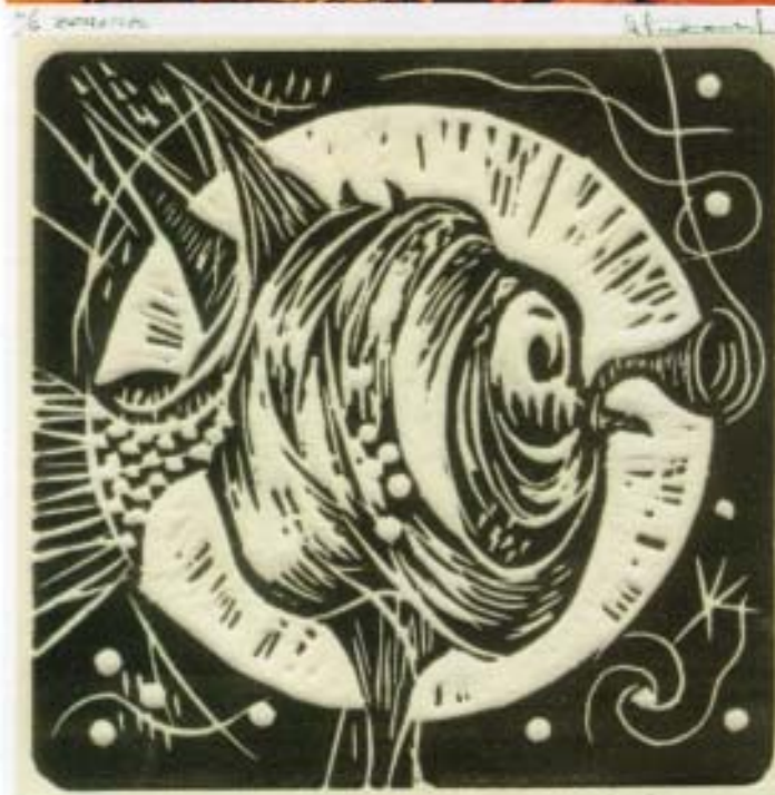
Celeiro. Xilografia. 12,5x12,5 cm.