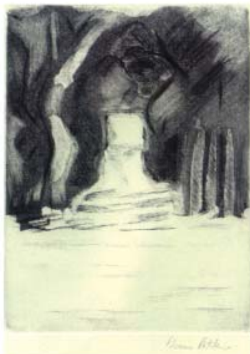
Diana Alitchison. Aguatinta/punta seca. 12,5x16,5 cm.