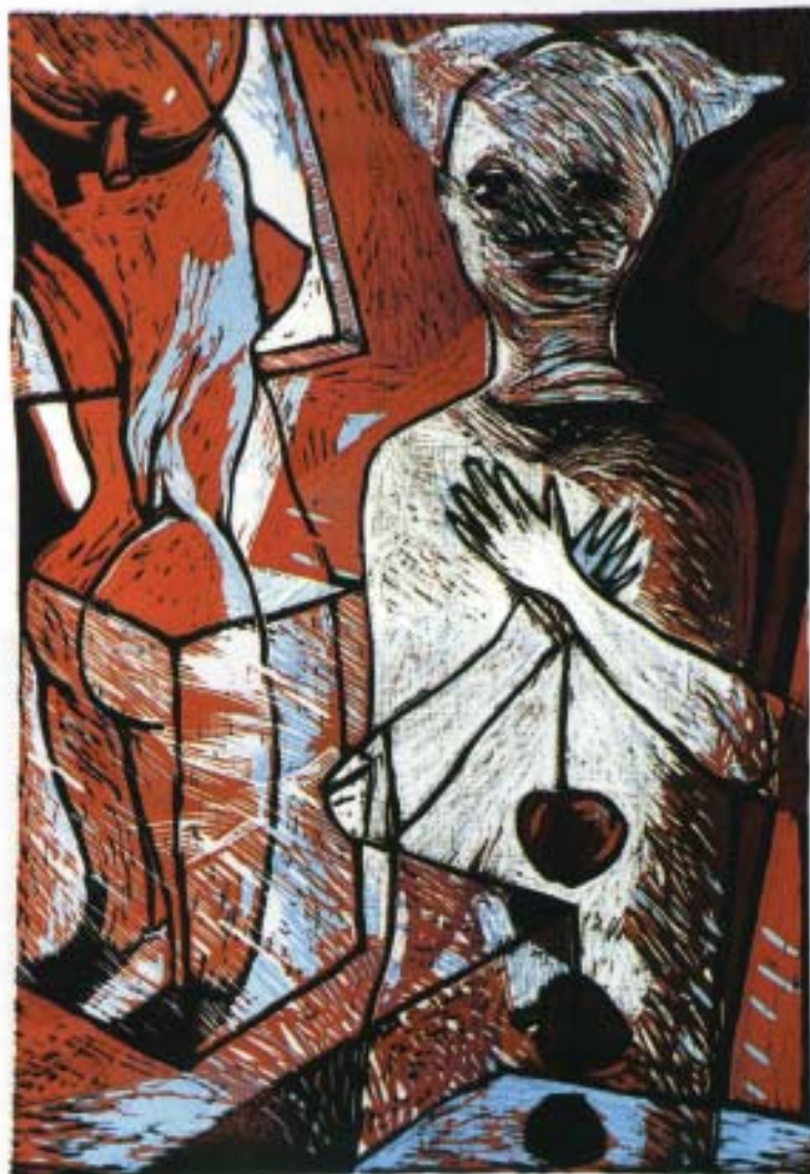
Omar Kessel. Amor preservativo.com. Linograbado. 29,5x44 cm.