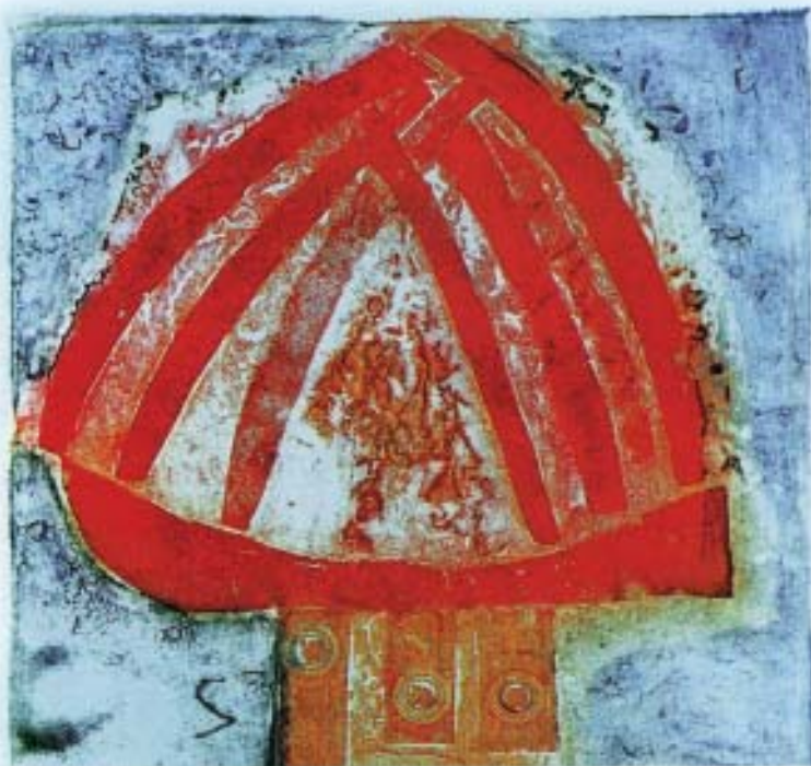
Blanca Silva. A festa . Aditivas en madera. 31x31 cm.