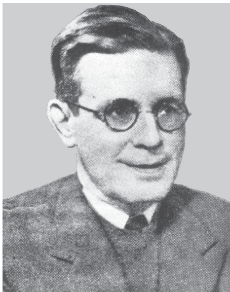
Ramón Vilar Ponte (Viveiro, Lugo, 1890, A Coruña, 1953).

Ramón participa na fundación das Mocedades Galeguistas (1934), pero case desaparece da escea política no decurso do debate sobre a integración electoral do P.Galeguista na