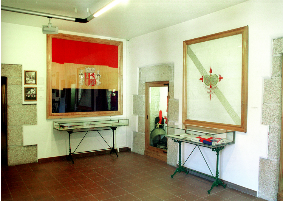
Bandeira do Goberno Republicano Español no exilio e Bandeira das Irmandades da Fala de Betanzos. Museo das Mariñas (Betanzos).