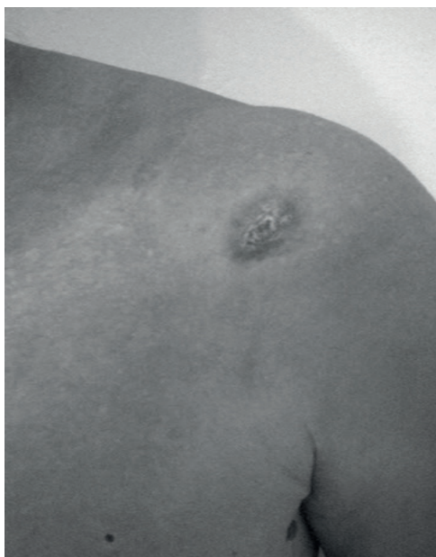
Figura 2. Placa hiperémica con fondo granulante en hombro izquierdo.

Basado en la apariencia clínica el diagnóstico diferencial de la lesión incluyó lepra, tuberculosis o micosis superficial. Se envió raspado de la muestra el 31 de marzo de 2016 y se obtuvieron los resultados el 4 de abril del propio año, que reportaban amastigotes de leishmania spp. El 10 de abril de 2016 se inició el tratamiento con antimonio de meglumina 1.5g I.M. por 20 días. El primer día presentó temperatura de 38°C acompañado de escalofríos. Acudió en una ocasión a la consulta médica por insomnio, anorexia y náuseas de tres días de evolución por lo que se ingresa por cuatro horas para vigilancia con sales de rehidratación oral y administración de metoclopramida 10mg I.V. Durante estos días de tratamiento presentó efectos adversos moderados: náuseas, cefalea, mareos, mialgias, artralgias, malestar general, diarrea, sialorrea y anorexia. (Cuadro 1)