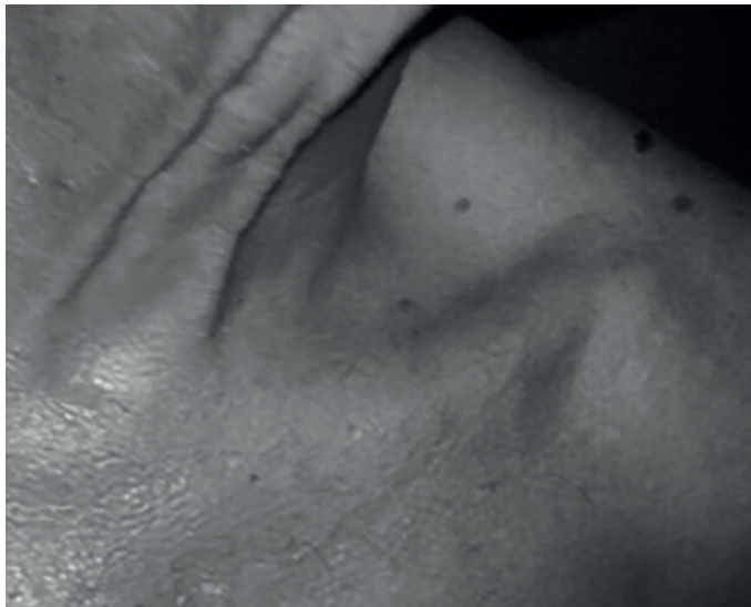
Figura 4. Recuperación total sin signos de reactivación.

Los antimoniales pentavalentes son los fármacos más utilizados a nivel mundial, pero tienen efectos adversos que en algunos casos no son tolerados por los pacientes y en muchas ocasiones requieren de largos periodos o discontinuación del tratamiento. (19) En este caso se observó el inicio de los efectos adversos desde el primer día de tratamiento, sin embargo, en el estudio realizado por Meléndez et al (20) "Estudio comparativo entre antimonio de meglumina intralesional versus tratamiento convencional intramuscular en el manejo de leishmaniasis cutánea atípica" se observó un menor número de reacciones adversas y se iniciaron a las dos semanas del inicio del tratamiento. En uno de los pacientes se observó incapacidad