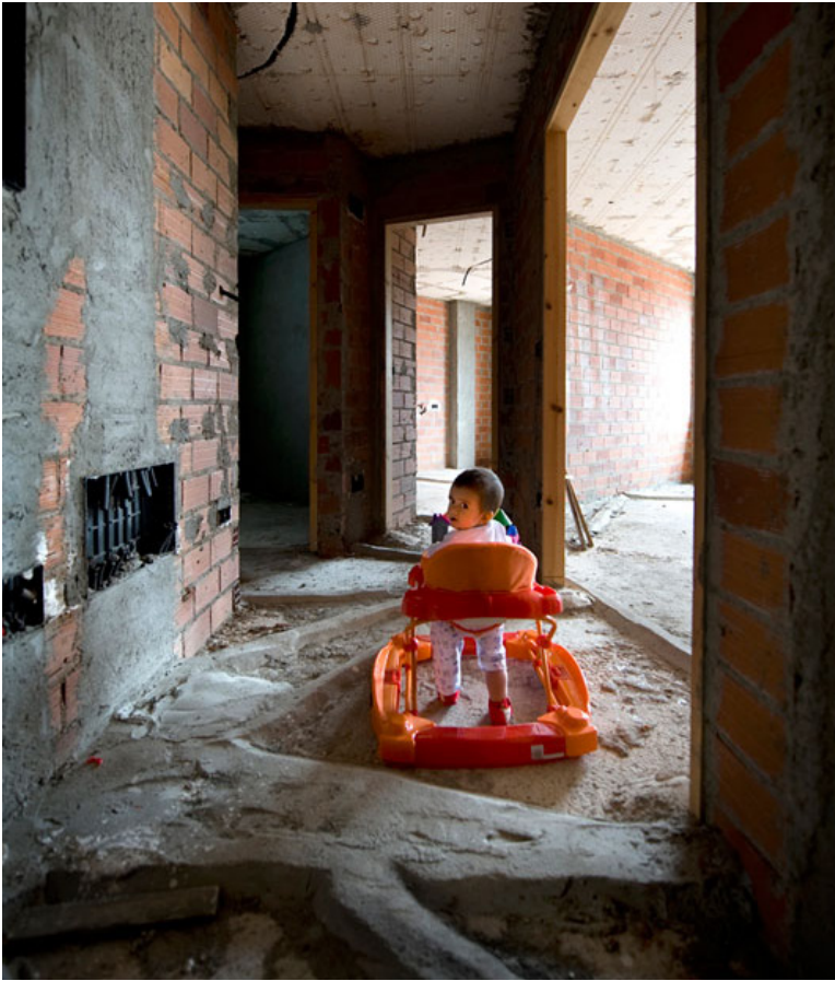
Figura 2. Unfinished - Miradas: Pabellón de España XV Bienal de arquitectura de Venecia (2016). León de Oro.

de Kansai en Japón representa una de las más costosas batallas por evitar la desaparición de una arquitectura desde que se descubrió que la isla artificial sobre la que fue construida se hundía mucho más rápido de lo previsto (Al-Badri, 2003). Esta situación ha llevado a implementar, desde su inauguración, diversas reparaciones en el edificio, las cuales, sin embargo, no evitaron que las pistas del aeropuerto más costoso del mundo quedaran bajo el agua en 2018, a la llegada del tifón Jebi, situación que sigue cuestionando la viabilidad estructural y financiera de esta infraestructura.