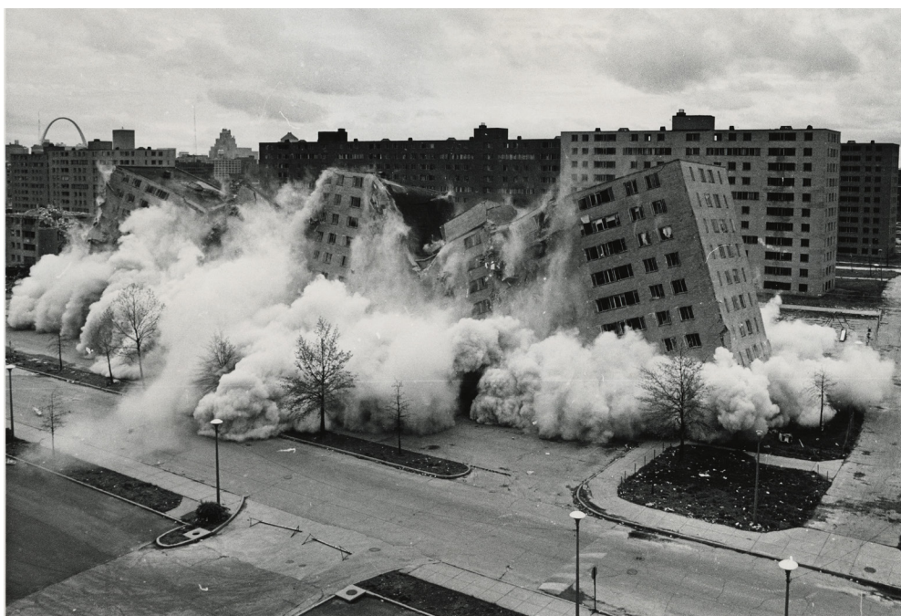
Figura 3 Demolición de Pruitt Igoe, Missouri, USA.

Todo lo anterior llevó a desarrollar una investigación que abordara el fenómeno de lo efímero en la arquitectura reciente en Colombia, siguiendo una hipótesis principal: el afán por anteponer los resultados a la calidad, y la economía a la duración, ha gestado una noción soterrada de lo efímero en arquitectura, como condición subyacente en las actuales políticas y modos de gestión de los proyectos. A partir de esta hipótesis, este artículo elabora un modelo interpretativo de lo efímero en la arquitectura contemporánea en Colombia a comienzos del siglo XXI, como resultado de tales políticas de gestión, con el objetivo de evidenciar una aproximación otra de la noción de lo efímero en arquitectura.