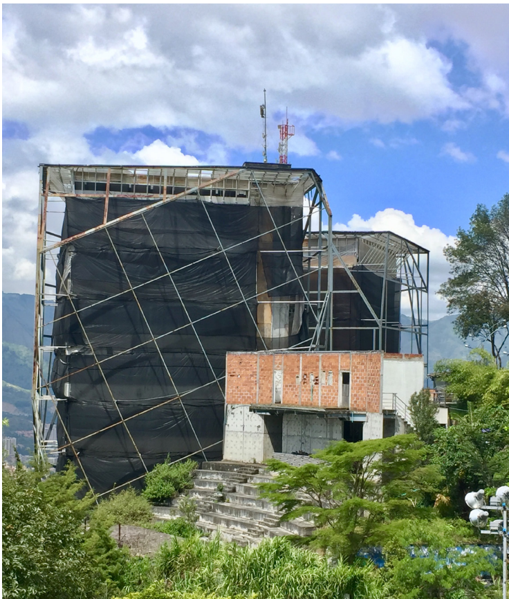
Figura 5 Biblioteca España, Medellín.

El Parque Biblioteca España hizo parte del conjunto de cinco Parques Biblioteca construidos en la ciudad de Medellín, que -salvo el caso en mención- se mantienen en funcionamiento hasta el día de hoy. Inaugurado por los reyes de España en 2007, la biblioteca empezó a sufrir filtraciones de agua por sus fachadas poco tiempo después de su apertura, posteriormente fue el recubrimiento de las fachadas el que sufrió desperfectos que provocaron su progresivo desprendimiento hasta hacer imposible el uso de los espacios, lo que llevó a su cierre en 2013, recientemente, un estudio de vulnerabilidad determinó que la estructura tampoco cumple con las normas de sismo resistencia. A pesar de los estudios realizados por diferentes instituciones, tendientes a buscar soluciones que hagan viable nuevamente el proyecto, lo cierto