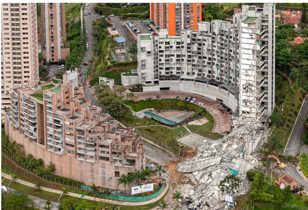
Figura 4 Edificio Space - Medellín.

tan por lo tanto, un hábitat ideal de arquitectura, que de repente desaparece por fallos constructivos y/o de diseño, convirtiendo en ruinas lo que otrora fue un espacio ideal, un fenómeno inusitado en el que el diseño arquitectónico y/o constructivo de estas arquitecturas es la que determina la medida temporal de su existencia; de manera que lo que estaba previsto para durar muchos años, se convierte en perezoso por la coyuntura de una situación, por la imprevisión de una realidad. Lo efímero, entonces, se encuentra atado en estos casos a una condición de consecuencia repentina y no de causa planificada, como ocurre con la mayoría de las arquitecturas previsiblemente efímeras. En síntesis, las utopías de lo efímero son una construcción de la destrucción.