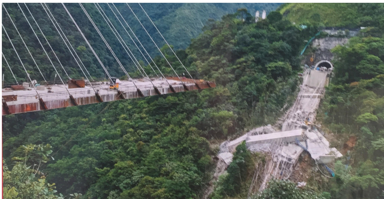
Figura 1 Puente Chirajara. Fuente: Guillermo Torres (2018).

Así, vemos cómo la otrora condición –sine qua non– del firmitas en arquitectura, ha empezado a verse comprometida en Colombia, lo que ha configurado un panorama inusitado de la arquitectura efímera que redefine la noción tradicional de lo que se considera efímero en arquitectura. Entre 2018 y 2019 se han demolido 6 infraestructuras de reciente edificación, y a la fecha se mantienen numerosas infraestructuras públicas sin finalizar, algunas desde hace más de 30 años; la decisión de la multinacional portuguesa Mota Egil, el pasado mes de septiembre, de no terminar la construcción de aproximadamente 246 colegios en el país dejándolos en el limbo de la ruina no hace más que subrayar esta tendencia.