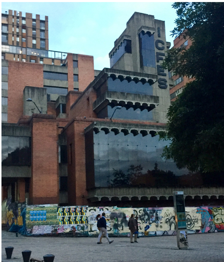
Figura 6 William García (2019) Edificio ICFES. Arq. Aníbal Moreno.

Aunque previstas para ser ocupadas y utilizadas por largos periodos, algunas de estas distopías de lo efímero son arquitecturas que quedaron atrapadas en un limbo entre la construcción y la ocupación efectiva de estos espacios, arquitecturas efímeras en el sentido de lo pasajero, en su acepción de lo transeúnte, de lo que está en permanente estado de tránsito, entre la construcción y la ocupación, entre la construcción y la ruina. En este caso, la condición de lo efímero, en términos de tiempo, tiene que ver con su duración incierta, un lento devenir sin fecha ni término, es el paso constante del tiempo sin que jamás se finalice la construcción. En estos casos, la acción de la intemperie y la inacción de sus dueños son las causas de la lenta desaparición de estos inmuebles. Si de lo efímero solo queda el recuerdo de una experiencia, de las distopías de lo efímero sólo queda el olvido, pues se trata de edificios sin habitantes que las ocupen, ni ciudadanos que las recuerden. Así, lo efímero no solo implica la ausencia de tiempo, sino la ausencia de actividad que valide la existencia de estos espacios.