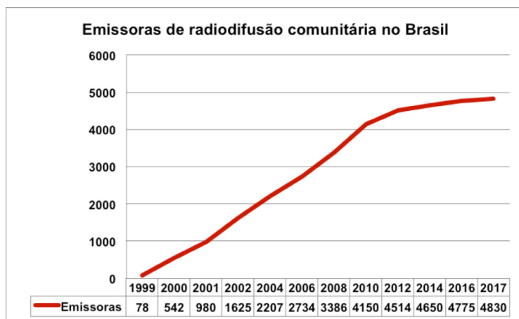
Gráfico 1 – Variação do número de emissoras comunitárias no Brasil (1999 – 2017)