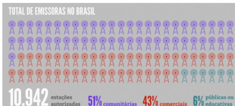
Figura 1 – Emissoras de rádio no Brasil segundo o tipo