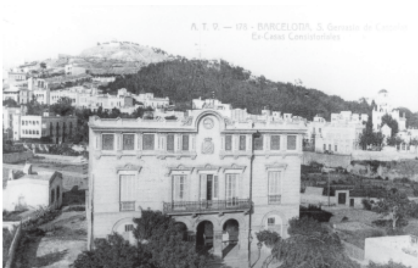
Edifici de l'ajuntament de l'antic municipi de Sant Gervasi de Cassolès, abans de ser annexionat a la ciutat de Barcelona.

El padró de la Riba de 1923 deix constància de quinze absents del poble que treballaven a Barcelona, entre els seus oficis hi ha sis cuiners, un cambrer, un serraller, un comerciant, un pagès i una minyona. 14 Precisament aquest enclau industrial, entre 1877-1897, va perdre 805 habitants, gairebé la meitat de la població, quan de 1.567 hab. davallà a 762 empadronats.