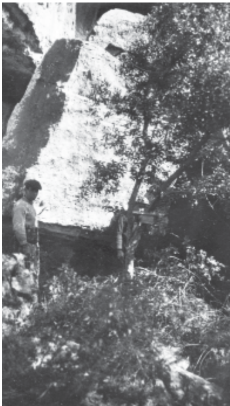
1. Entrada nord-oriental de la cova del Buldó.