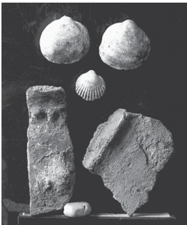
4. Elements arqueològics recuperats a la cova del Bul-dó. (Placa fotogràfica núm. 380 de l'arxiu del Museu de Reus, fons S. Vilaseca).