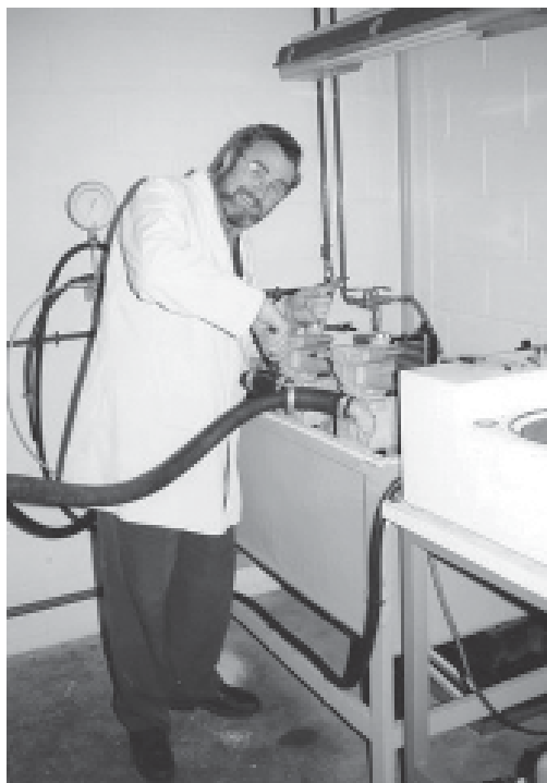
Al laboratori de Frape Behr, S.A. a Montblanc

El 22 d'octubre de 1989 mor l'avi, després d'una llarga malaltia. El trobaràs a faltar moltíssim, però em transmetràs tots aquells valors i estimacions que ell et va donar, mantenint-lo viu en el record. Aquest mateix any t'operen d'una apendicitis perforada.