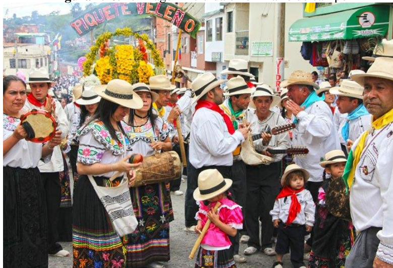
Figura Nro. 2: Imagen incluida en el Diario de campo