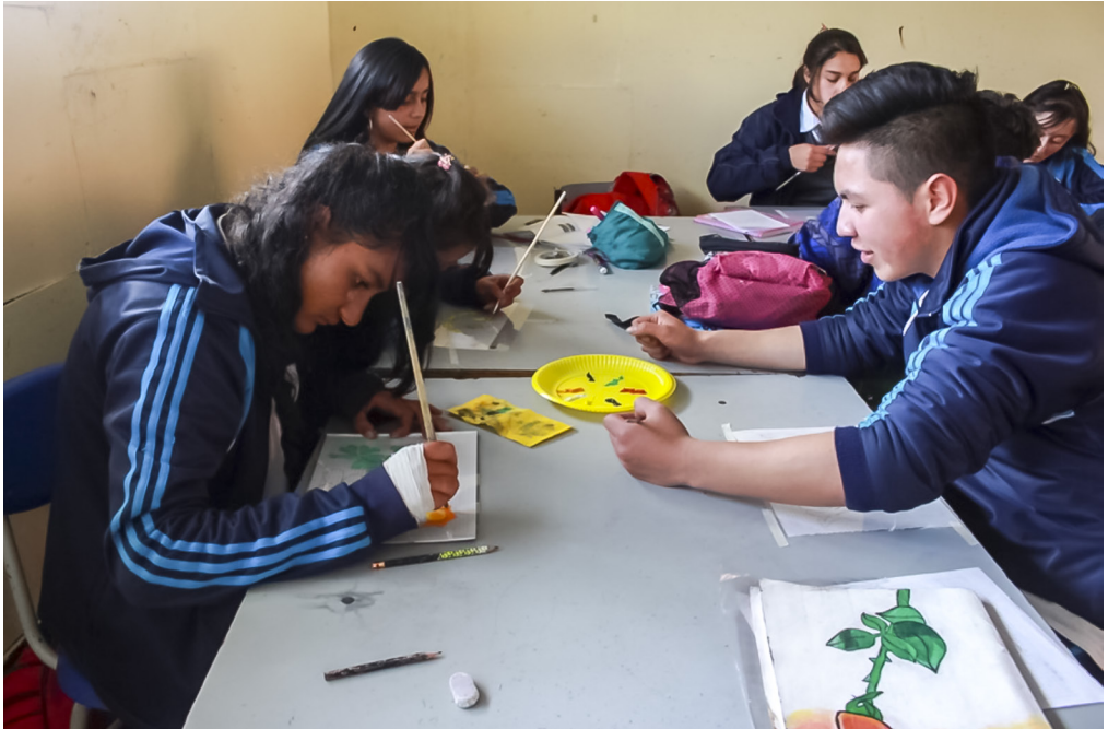
Figura 3. Pintando sobre los acetatos