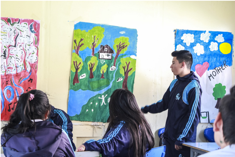
Figura 13. Socialización de los lugares ideales

Hemos de mencionar que este ejercicio se planteó para responder a la necesidad de lo que en se mencionaba en la sección “Bordes de sentido” sobre cómo enseñar a enfrentar las incertidumbres. En palabras de Morin (1999): “Hay que aprender a enfrentar la incertidumbre puesto que vivimos una época cambiante donde los valores son ambivalentes, donde todo está ligado. Es por eso que la educación del futuro debe volver sobre las incertidumbres ligadas al conocimiento” (p. 88). Esto coincide con el propósito que nos planteamos acerca de enseñar algo que superara el umbral del conocimiento útil a corto plazo y permitiera formar resistencia y capacidad inventiva.