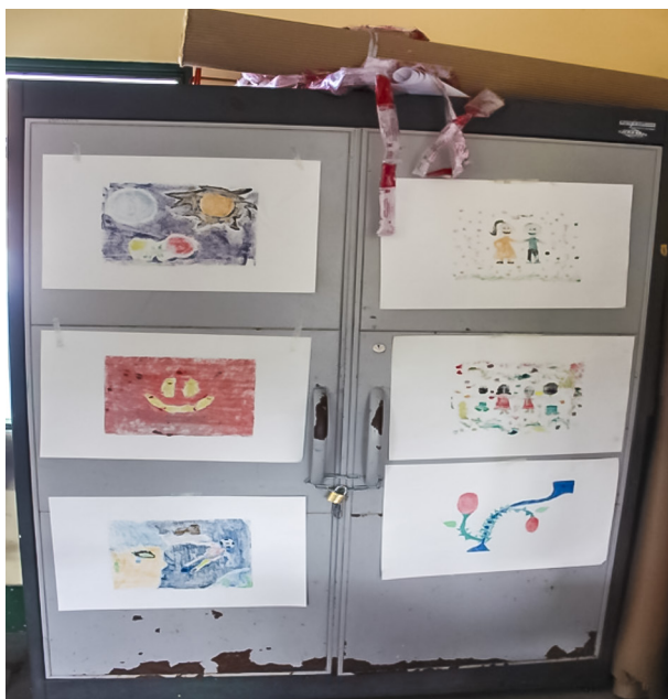
Figura 5. Resultados finales de monotipos

que dejarían su huella, y que de alguna manera darían felicidad a quienes los rodean. Volviendo a Shiller, retomamos su teoría del juego libre y de la imaginación productiva en cuanto a producción autónoma. Es decir, si los jóvenes son capaces de imaginarse un futuro mejor, es muy posible que luego de imaginarlo se haga realidad, pues su empeño estará en hacer posibles esos mundos mejores.