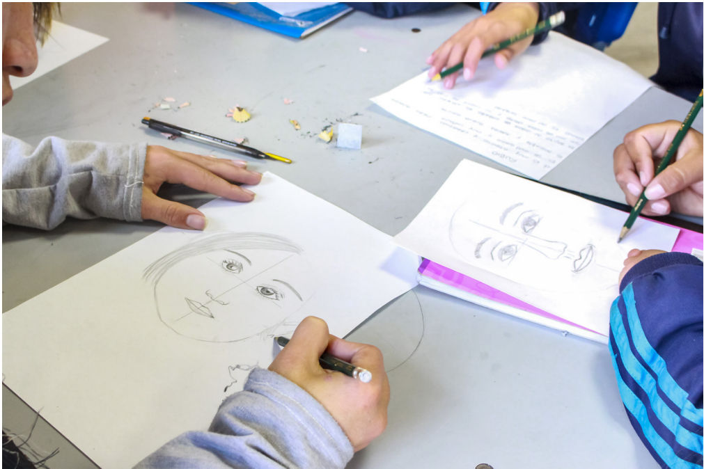
Figura 2. Desarrollo del ejercicio

Cuando a los estudiantes se les pidió que hicieran las descripciones de sus compañeros, fue difícil que pudieran escribir sobre el otro. Empezaron escribiendo cosas como “tiene pelo, ojos cafés y es callado”. Poco a poco pasamos acompañando el trabajo de cada estudiante y a fuerza de insistencia, de tener que observar a su compañero, se fueron dando cuenta de que podían ver las formas que los diferenciaban de los otros y las virtudes que cada uno tenía y se podían resaltar. De esta forma se puede ver que si no se acompaña el trabajo uno a uno, es posible que dejaran solo la descripción superficial de sus compañeros. Al principio casi que estaban esperando las instrucciones de lo que debían escribir. Al final salieron listados de características físicas que particularizaban a cada uno, y cualidades emocionales según el modo de relacionarse con los otros.