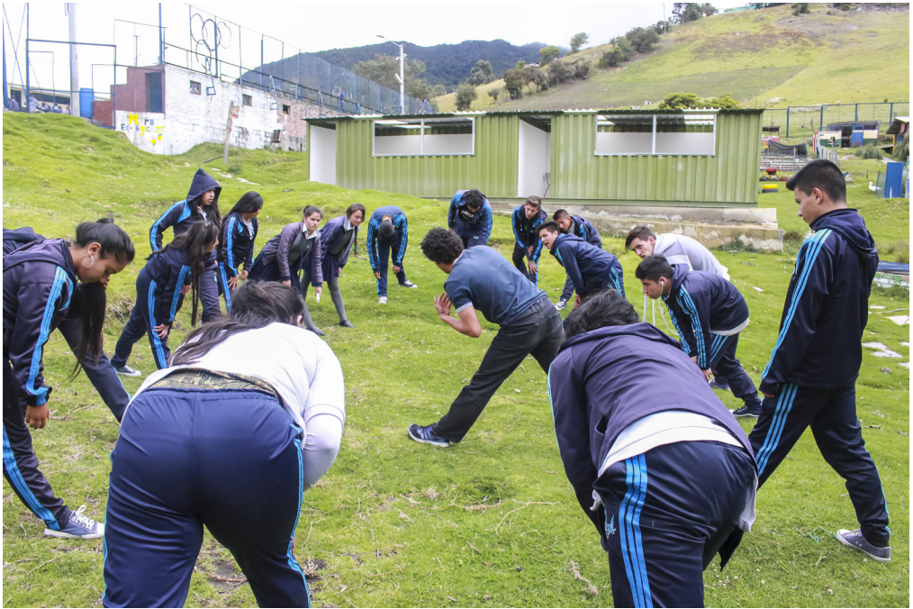
Figura 6. Ejercicio de Hatha Yoga