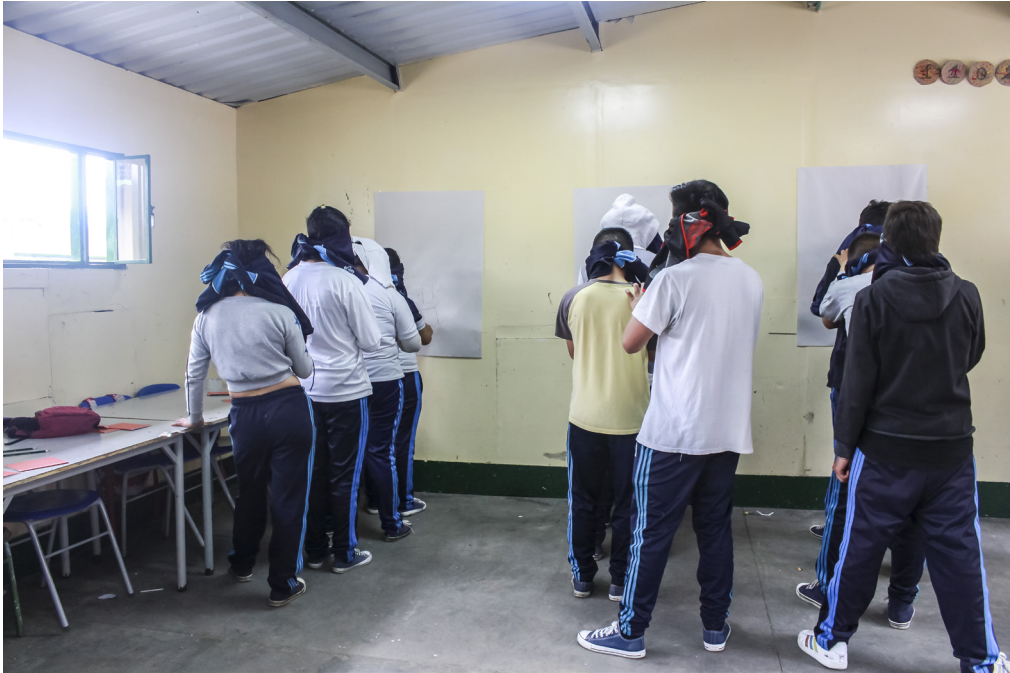
Figura 10. Estudiantes pintando su lugar ideal

La narración que hicieron en la bitácora dio paso a la creación de una imagen del lugar ideal que fue plasmada en un pliego de papel periódico. Para lograr dicha imagen, los estudiantes fueron organizados en grupos de cinco personas, cada grupo se ubicaba en una línea recta, y al estilo de “teléfono roto” debían transmitir su mensaje. Pero este no fue transmitido de forma verbal, sino que se comunicó a través del tacto. Cada uno debía trazar la imagen en la espalda de su compañero y el último lo dibujaba con un carboncillo sobre papel. Aquí tuvimos la intención de que se pensara lo visual desde otras perspectivas, puesto que en este ejercicio la representación no tenía referentes visuales sino táctiles, que se iban manifestando en la imaginación de los estudiantes. Finalmente, cada estudiante tomaba el resultado y a partir de las líneas generadas por su compañero y lo que había sentido en su espalda debía crear la imagen de su lugar ideal jugando con la creatividad de la disposición de los trazos sobre el plano pictórico (figuras 10 a 13).