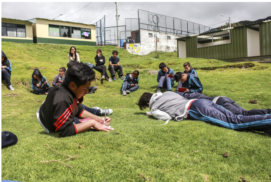
Figura 8. Los estudiantes escribiendo sobre su lugar ideal