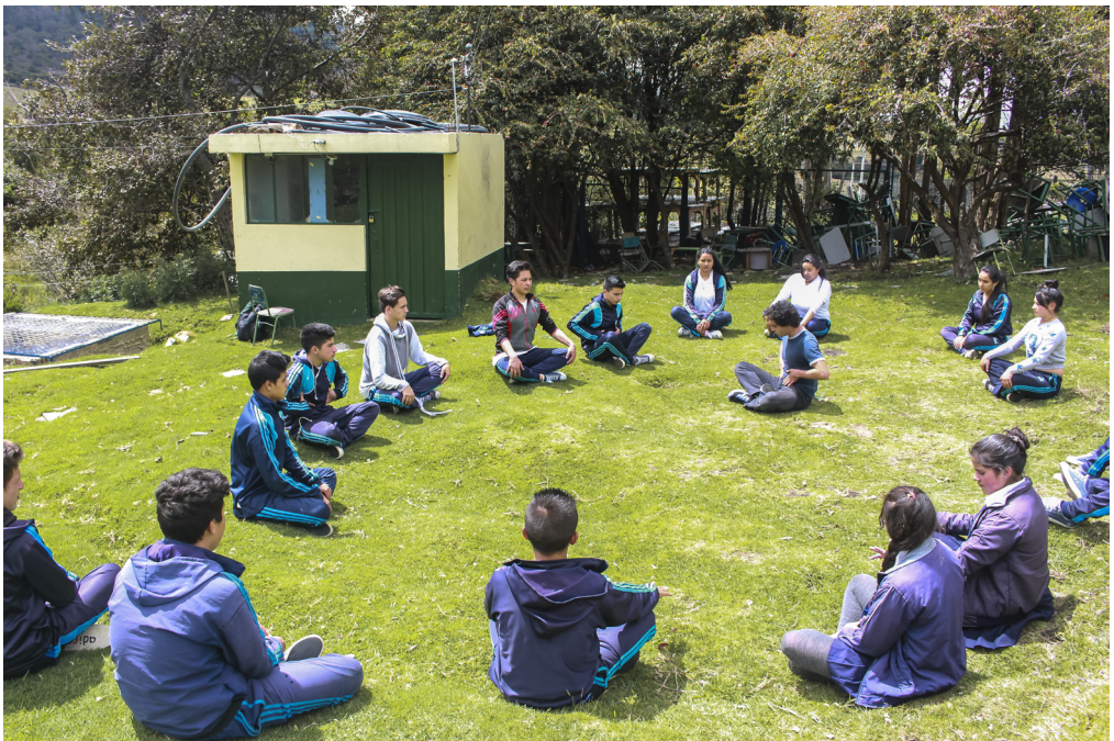
Figura 7. Ejercicio de Hatha Yoga