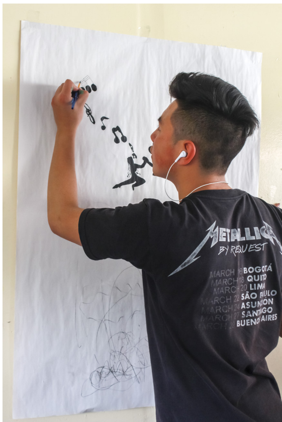
Figura 11. Estudiante pintando su lugar ideal