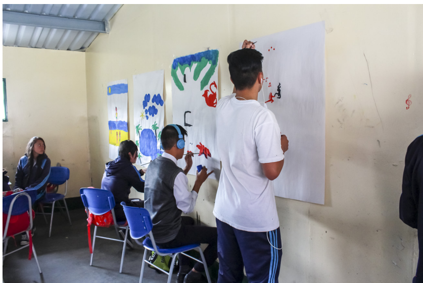
Figura 12. Estudiante pintando su lugar ideal