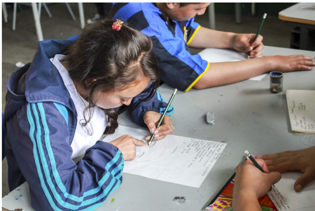
Figura 1. Inicio del ejercicio

Este ejercicio fue el primero que se llevó a cabo, y se hizo con la intención de presentarnos y acercarnos a los estudiantes, además de reconocer la forma en que los alumnos se percibían a sí mismos, sus dinámicas de relación y las de la institución dentro de las clases. El ejercicio consistía en hacer un retrato de dos compañeros. El primero se debía hacer con la técnica de dibujo figurativo, en el que se dispusiera la mayor cantidad de características físicas. El segundo consistió en una descripción verbal en la que se rescataran las características emocionales y actitudinales del compañero (figura 1).