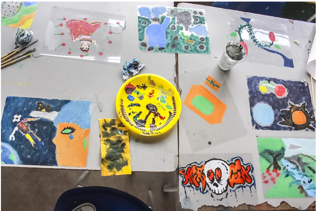
Figura 4. Monotipos sin imprimir